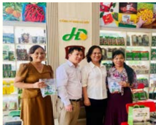
Doanh nghiệp Yên Bái - Bắc Kạn kết nối sản phẩm