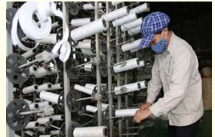
Sản xuất bao bì tại Công ty cổ phần Khoáng sản RED STONE (Khu Công nghiệp phía Nam, thành phố Yên Bái)

án sản xuất hạt nhựa và các sản phẩm nhựa - Công ty cổ phần Nhựa Châu Âu Yên Bái, tổng công suất: 450.000 tấn/năm; dự án sản xuất các sản phẩm gỗ và ván lát sàn SPC Thiên Hòa - Công ty TNHH công nghệ Thiên Hòa, sản phẩm ván lát sàn SPC 1 triệu m2/năm; Tủ bếp 100.000 bộ/năm; dự án chế biến đá xẻ, bột đá trắng và viên nén năng lượng xanh Yên Bái - Công ty cổ phần Khoáng sản năng lượng xanh Yên Bái với sản phẩm đá xẻ: 6.000 m3/năm. Giá trị sản xuất công nghiệp (theo giá so sánh