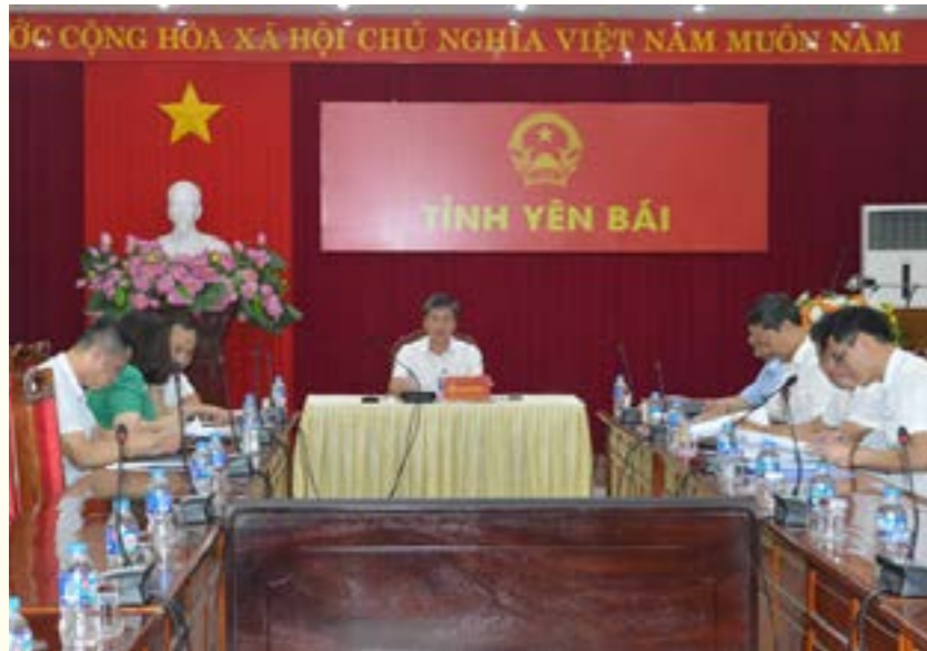
Quang cảnh hội nghị tại điểm cầu Yên Bái

mặt trời tập trung trong Quy hoạch điện VIII, có giải pháp phù hợp, khả thi, bảo đảm đáp ứng yêu cầu phát triển khi Nghị định quy định cơ chế mua bán điện trực tiếp giữa đơn vị phát điện năng lượng tái tạo với khách hàng sử dụng điện lớn được ban hành phù hợp với tình hình thực tế, điều kiện vận hành an toàn hệ thống điện quốc gia...Đồng thời trao đổi các vấn đề cụ thể như điều chỉnh phân bổ công suất nguồn cho từng địa phương; các dự án thủy