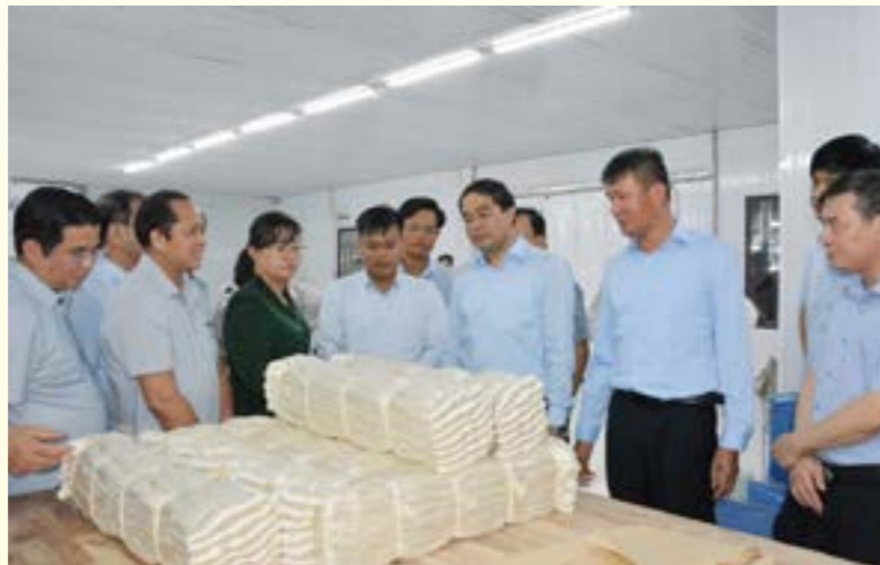
Sản phẩm tơ tằm của công ty Công ty CP dâu tằm tơ Trấn Yên là một trong số sản phẩm mới của tỉnh xuất khẩu sang thị trường Nhật Bản

Nhật Bản là đối tác thương mại thứ 4 của Việt Nam (sau Hoa Kỳ và Trung Quốc và Hàn Quốc). Hai nước còn nhiều dư địa, tiềm năng hợp tác thương mại theo thỏa thuận song phương và đa phương. Đối với tỉnh Yên Bái, một số mặt hàng có tiềm năng, lợi thế đã và có thể khai thác ở thị trường Nhật Bản đó là: gỗ và các sản phẩm chế biến từ gỗ; các sản phẩm chất dẻo; chè, quế và các sản phẩm từ quế, khoáng sản (đá xẻ, bột đá...). Nhưng hiện nay tỉnh Yên Bái mới chỉ có một số sản phẩm xuất khẩu sang thị trường Nhật Bản song giá trị còn thấp đó là: măng tre Bát độ, khoáng sản, đũa gỗ, sản phẩm may mặc, tơ tằm. Những năm gần đây tỷ trọng xuất khẩu sang thị trường Nhật Bản