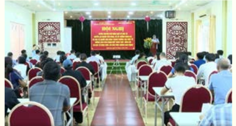
Quang cảnh hội nghị

Ngày 01 tháng 8 năm 2024, Sở Công Thương (thường trực Hội Bảo vệ quyền lợi người tiêu dùng tỉnh Yên Bái) phối hợp với Cục quản lý thị trường tỉnh, Sở Thông tin và truyền thông và các đơn vị liên quan tổ chức Hội nghị tuyên truyền phổ biến Luật Bảo vệ quyền lợi người tiêu dùng, đề án chống hàng giả và bảo vệ người tiêu dùng trong thương mại điện tử, hướng dẫn cách nhận biết hàng thật, hàng giả và một số hình thức lừa đảo trên không gian mạng.