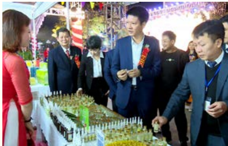
Ngành Công Thương tỉnh Yên Bái đã triển khai nhiều hoạt động hỗ trợ giúp các doanh nghiệp, hợp tác xã đẩy mạnh xúc tiến thương mại, giới thiệu các sản phẩm OCOP, sản phẩm đặc sản của tỉnh.