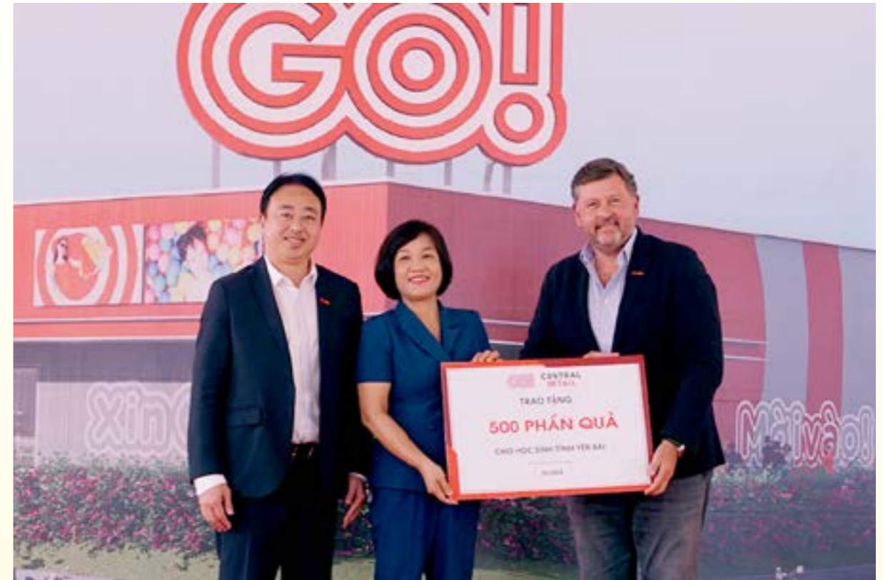
500 phần quà đồ dùng học tập được Tập đoàn Central Retail Việt Nam gửi tặng cho học sinh có hoàn cảnh khó khăn trên địa bàn tỉnh Yên Bái

lực của tỉnh Yên Bái đến với người tiêu dùng. Tỉnh cam kết sẽ tiếp tục đồng hành, hỗ trợ, tạo mọi điều kiện thuận lợi nhất cho nhà đầu tư trong suốt quá trình triển khai đầu tư, kinh doanh Dự án.