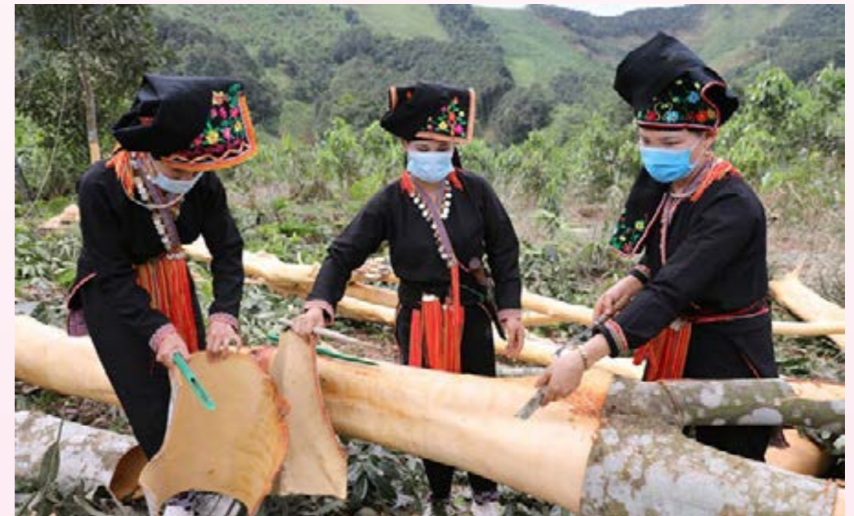
Quế là 1 trong 10 cây trồng chủ lực của huyện Yên Bái. Ảnh; Đồng bào Dao Văn Yên thu hoạch quế vỏ.

huyện Văn Yên tổ chức Hội nghị triển khai xây dựng hệ sinh thái tận dụng FTA hỗ trợ sản xuất, chế biến, tiêu thụ sản phẩm quế trên địa bàn tỉnh Yên Bái năm 2024. Nhằm nắm bắt những khó khăn vướng mắc để có giải pháp tháo gỡ cho các doanh nghiệp quế của tỉnh; cung cấp thông tin về quy mô, nhu cầu thị trường xuất khẩu, tạo đòn bẩy thúc đẩy phát triển và tháo gỡ những khó khăn trong kết nối chuỗi chế biến; quy trình sản xuất, vốn và công nghệ; xây dựng thương hiệu,..., góp phần cải thiện chỉ số PCI của tỉnh và thúc đẩy giá trị xuất khẩu trong thời gian tới.