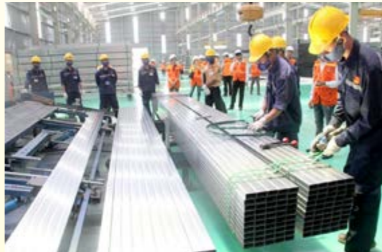
Sản xuất thép hộp tại Tôn Hoa Sen Yên Bái

Bám sát, cụ thể hóa triết lý phát triển của tỉnh Yên Bái: “Xanh, hài hòa, bản sắc và hạnh phúc”, trong lĩnh vực Công Thương, Tỉnh ủy, HĐND, UBND tỉnh đã chỉ đạo các ngành phối hợp xây dựng và ban hành Nghị quyết số 29-NQ/TU ngày 24/02/2021 của BCH Đảng bộ tỉnh khóa XIX về phát triển công nghiệp tỉnh Yên Bái theo hướng bền vững, hiệu quả và thân thiện với môi trường giai đoạn 2021-2025, UBND tỉnh đã ban hành Chương trình hành động số 06/CTr- UBND ngày 25/6/2021 thực hiện nghị quyết số 29-NQ/TU; ban hành Quyết định số 1593/QĐ-UBND ngày 29/7/2021 phê duyệt và triển khai thực hiện đề án cơ cấu lại ngành công nghiệp tỉnh Yên Bái giai đoạn 2021-2025. Từ đó, tạo cơ sở quan trọng về định hướng quy hoạch, kế hoạch phát triển ngành công nghiệp theo hướng “Xanh”, bền vững, thân thiện với môi trường.