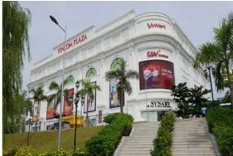
Vincom là trung tâm thương mại lớn nhất Yên Bái

Tỉnh còn đầu tư đồng bộ và hoàn thiện hạ tầng lưới điện: Xây dựng hoàn thành trạm 110kV Văn Yên, trạm 110kV Yên Bái 2 và nâng công suất máy biến áp T1 của TBA110kV Yên Bái. Các dự án 220kV, 110kV, lưới điện truyền tải 500kV, 220kV, 110kV đang được thực hiện sẽ hoàn thành trong giai đoạn đến 2025. Tiếp tục đầu tư xây dựng lưới điện nông thôn, đến nay số hộ được sử dụng điện đạt 97,6%, tiến tới năm 2025 đảm bảo 99% số hộ được dùng điện.