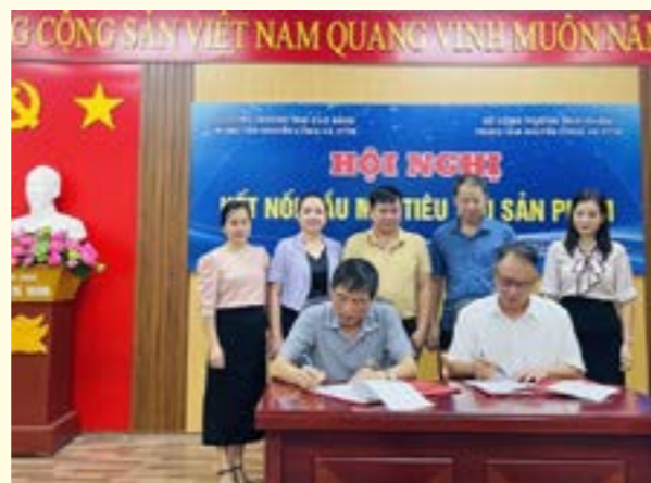
Trung tâm Khuyến công và xúc tiến Thương mại tỉnh Cao Bằng và Yên Bái ký kết biên bản ghi nhớ

Một số hình ảnh lễ ký kết biên bản ghi nhớ và giao thương hàng hoá của các doanh nghiệp tỉnh Yên Bái với các doanh nghiệp tỉnh Cao Bằng.