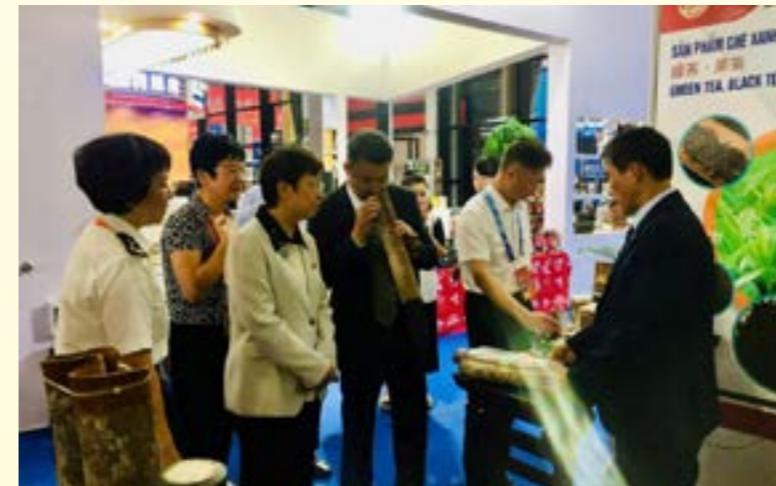
Nhiều khách hàng quốc tế tham quan gian hàng của tỉnh Yên Bái

Trong những ngày diễn ra Hội chợ gian hàng của tỉnh Yên Bái đã thu hút được sự quan tâm của hơn 10.000 người dân và hơn 100 doanh nghiệp Trung Quốc, Hồng Kông (Trung Quốc) và các nước trong khu vực ASEAN khi tới tham gia Hội chợ. Trong đó có hơn 20 doanh nghiệp Trung Quốc đã tìm hiểu lấy thông tin