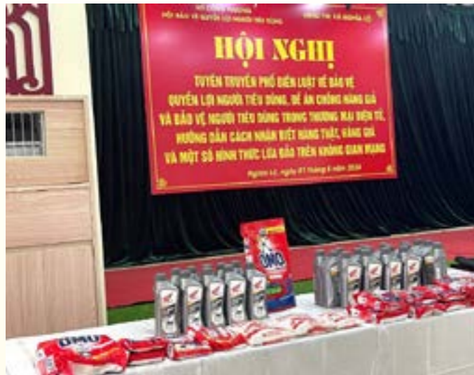
Bàn trưng bày phân biệt hàng thật, hàng giả

tiêu dùng. Tại hội nghị này, các đại biểu đã được nghe ý kiến truyền đạt của đại diện Sở Công Thương về phổ biến Luật BVNTD, cũng như lưu ý những điểm mới của Luật so với Luật cũ năm 2010. Đại diện Cục Quản lý Thị trường truyền đạt đề án chống hàng giả và bảo vệ người tiêu dùng trong thương mại điện tử, hướng dẫn cách nhận biết hàng thật, hàng giả. Đại diện Sở thông tin và truyền thông tuyên truyền cảnh báo các hình thức lừa đảo, gian lận trên không gian mạng năm 2024. Đồng thời, các tổ chức, cá nhân kinh doanh trên không gian mạng thôn.