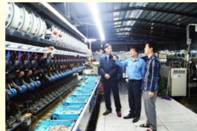
Sản xuất bao bì tại Công ty cổ phần Khoáng sản RED STONE (Khu Công nghiệp phía Nam, thành phố Yên Bái)

có quy mô lớn, có năng lực cạnh tranh; đưa Yên Bái trở thành trung tâm chế biến gỗ rừng trồng công nghệ cao của vùng Trung du và miền núi phía Bắc: Ngành sản xuất chế biến gỗ rừng trồng đã có bước phát triển nhanh, có sự liên kết trong sản xuất tiêu thụ sản phẩm, một số sản phẩm chất lượng cao, có thị trường xuất khẩu ổn định. Một số dự án chế biến gỗ công nghệ cao đã hình thành và đi vào hoạt động tại khu công nghiệp Phía Nam, Minh Quân. Đặc biệt,