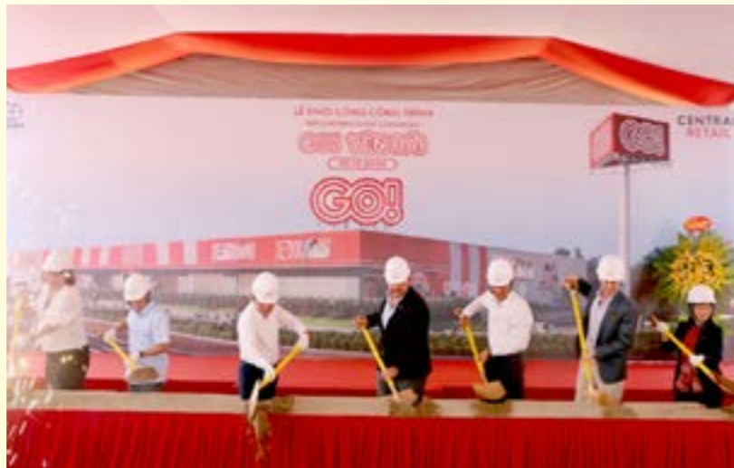
Các đại biểu thực hiện nghi thức động thổ công trình Trung tâm thương mại GO! Yên Bái

Đồng chí Phó Chủ tịch Thường trực UBND tỉnh mong rằng Dự án khi đi vào hoạt động sẽ là một kênh giới thiệu, tiêu thụ hàng hóa chủ