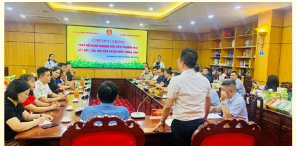
Quảng cảnh buổi làm việc với Trung tâm XTMM Thái Nguyên

Một số hình ảnh của đoàn công tác tại các tỉnh Thái Nguyên, Bắc Kạn và Cao Bằng: