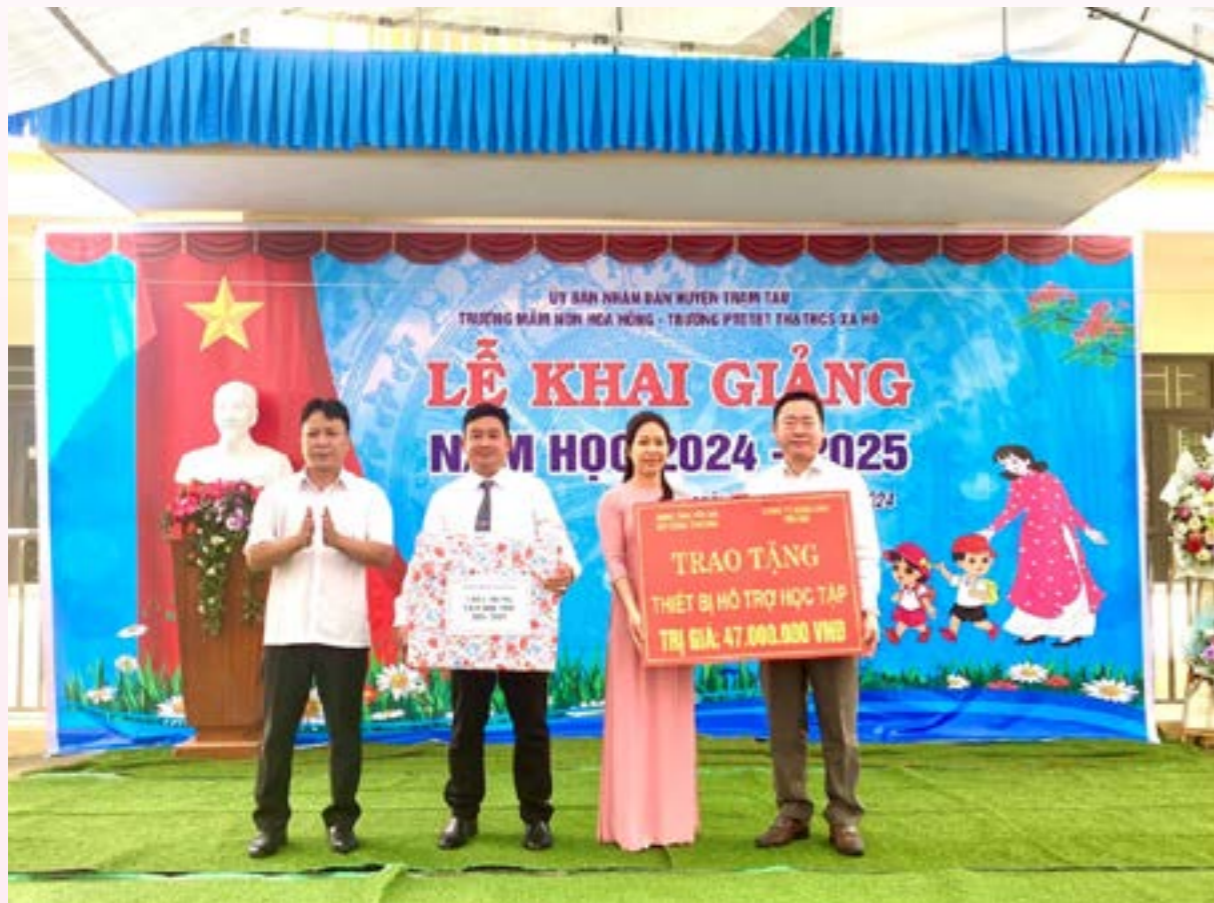
Các doanh nghiệp, HTX trao đổi thảo luận

Sáng ngày 05/9/2024 Lãnh đạo Sở Công Thương tỉnh Yên Bái đã đến dự Lễ khai giảng năm học mới 2024 - 2025 tại Trường Phổ thông dân tộc bán trú TH&THCS - Trường mầm non Sơn Ca xã Bản Công và Trường Phổ thông dân tộc bán trú TH&THCS - Trường mầm non Hoa Hồng xã Xà Hồ, huyện Trạm Tấu, tỉnh Yên Bái. Buổi lễ diễn ra trong không khí hân hoan, đầy hào hứng của học sinh, phụ huynh và cán bộ giáo viên nhà trường.