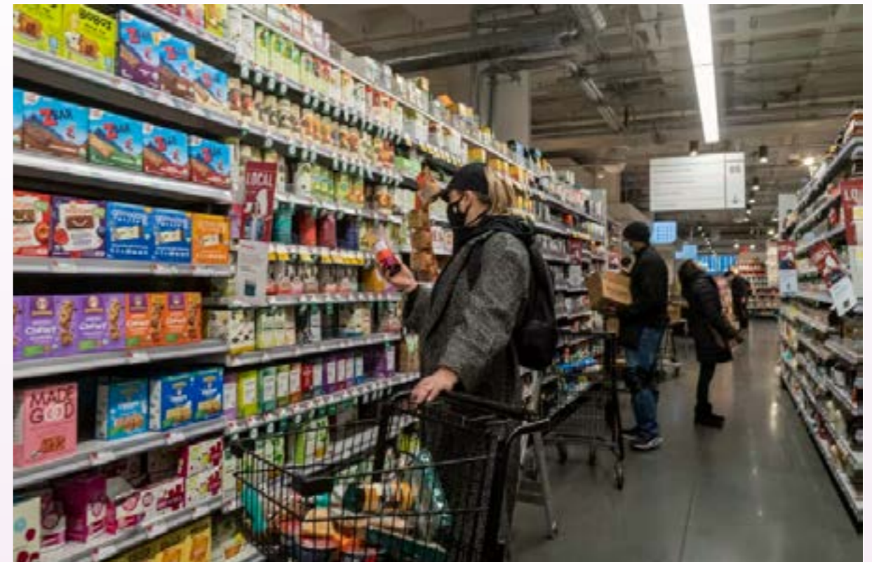
OECD nhận định, tăng trưởng của Hoa Kỳ tăng trong Quý II/2024 nhờ tiêu dùng cá nhân tăng

Trong Báo cáo Triển vọng kinh tế sơ bộ tháng 9/2024, Tổ chức Hợp tác và Phát triển kinh tế (OECD) nhận định kinh tế thế giới vẫn kiên cường trong nửa đầu năm 2024 khi đạt mức tăng trưởng 3,2%, tăng 0,1 điểm phần trăm so với dự báo trong tháng 5/2024. Lạm phát giá tiêu dùng giảm góp phần hỗ trợ chi tiêu hộ gia đình, phần nào trung hòa tác động tiêu cực từ các điều kiện tài chính hạn chế và bất ổn