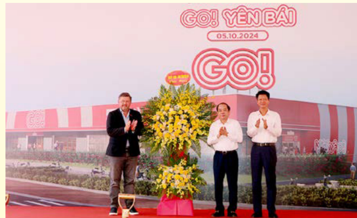
Các đồng chí lãnh đạo tỉnh Yên Bái tặng hoa chúc mừng Tập đoàn Central Retail Việt Nam tại Lễ khởi công.

Dự án được xây dựng trên diện tích gần 13.000 m 2 , gồm 1 tầng thương mại, được xây dựng theo mô hình đa tiện ích bao gồm mua sắm, ăn uống, học tập, vui chơi, phát triển bền vững với quy mô đầu tư xây dựng, gồm các hạng mục như: siêu thị; khu kinh doanh dịch vụ ăn uống, nhà hàng; khu vui chơi, giải trí; khu