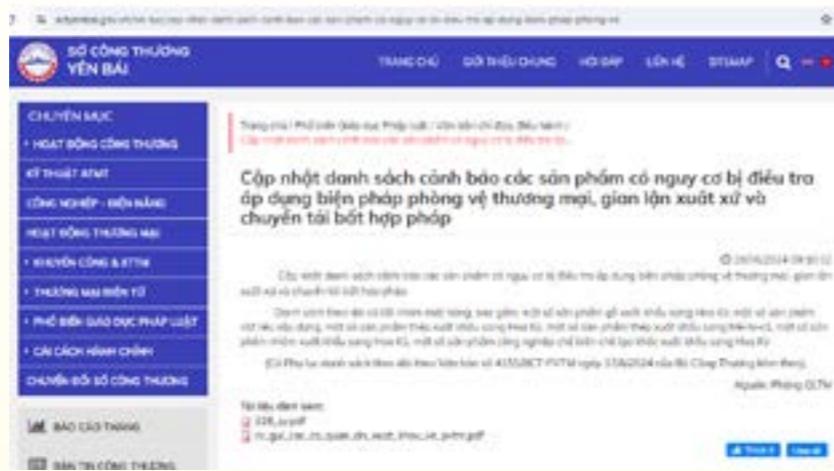
Chuyên mục tuyên truyền, phổ biến, giáo dục pháp luật trên Trang Thông tin điện tử của Sở Công Thương Yên Bái tại địa chỉ sctyenbai.gov.vn .

Phát huy thế mạnh công nghệ, Sở đã áp dụng việc tuyên truyền, PBGDPL trên các nền tảng mạng xã hội như Zalo, Facebook... bằng việc cung cấp thông tin, các quy định của pháp luật vào các hội, nhóm chính thức của cơ quan. Là thành viên Hội đồng phối hợp PBGDPL tỉnh,