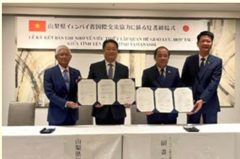
Lãnh đạo tỉnh Yên Bái và chính quyền tỉnh Yamanashi ký kết thỏa thuận khung về triển khai các hoạt động hợp tác giữa hai bên.

cho các doanh nghiệp xuất khẩu tham gia Hội nghị xuất nhập khẩu vùng Trung du miền núi phía Bắc tại Lào Cai; Chương trình kết nối với doanh nghiệp Liên bang Nga tại Hà Nội; tham dự khóa đào tạo “Nâng cao kiến thức về Halal trong ngành thực phẩm và các lĩnh vực liên quan đến công nghiệp chế biến” và tham dự Chương trình kết nối giao thương giữa nhà