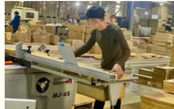
Sản xuất tủ bếp gỗ xuất khẩu của Công ty TNHH Sản xuất và Đầu tư Lâm Phong, Khu công nghiệp Minh Quân, huyện Trấn Yên

Đến nay, tỉnh Yên Bái đã từng bước thu hút được các nhà đầu tư lớn, dự án lớn như: Dự