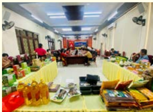
Quang cảnh buổi làm việc với Trung tâm KC&XTTM Cao Bằng