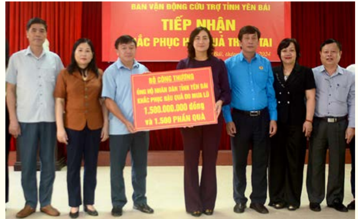
Thứ trưởng Bộ Công thương, Phan Thị Thắng và Đoàn công tác trao tiền hỗ trợ 1,5 tỷ đồng hỗ trợ người dân tỉnh Yên Bái khắc phục bão lũ

Thứ trưởng Bộ Công thương mong tỉnh Yên Bái sớm khắc phục hậu quả cơn bão, tổ chức lại cuộc sống. Thứ trưởng cũng chia sẻ thêm, đây là những hỗ trợ ban đầu, trong quá trình khắc phục khó khăn tiếp theo, ngành công thương cũng sẽ tiếp tục hỗ trợ trong phạm vi quản lý Nhà nước và điều phối của ngành. Đồng thời, quan tâm đến việc cùng với tỉnh hỗ trợ người dân từ hoạt động sản xuất đến máy