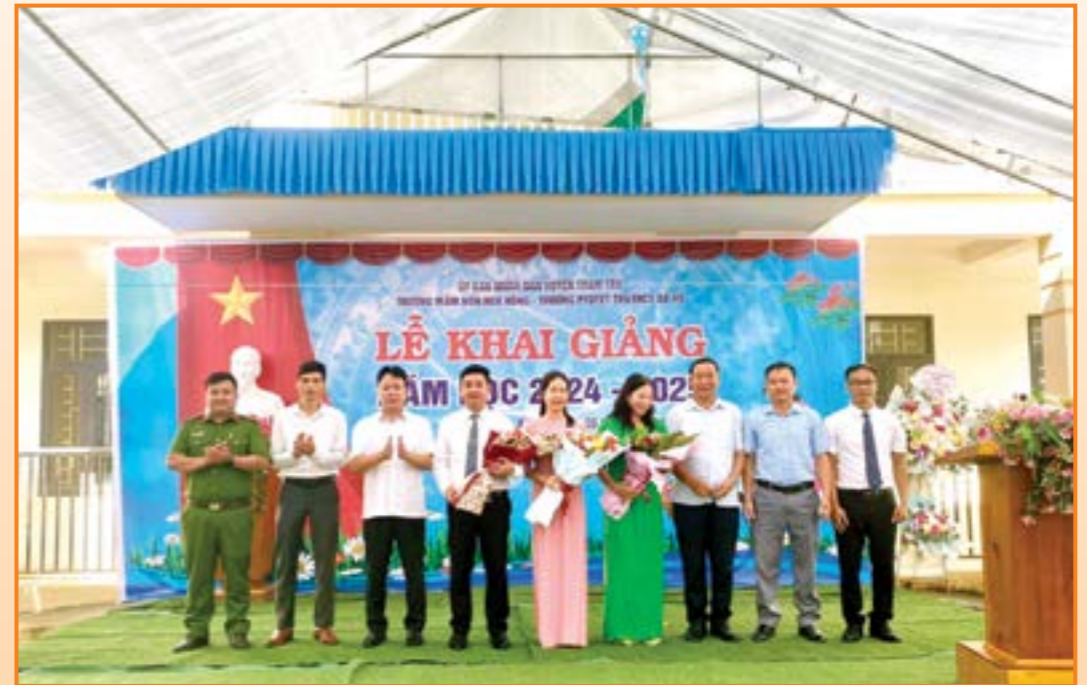
Lãnh đạo Sở Công Thương tỉnh Yên Bái đã có bó hoa tươi thắm chúc mừng thầy cô giáo, học sinh nhân dịp khai giảng năm học 2024 - 2025