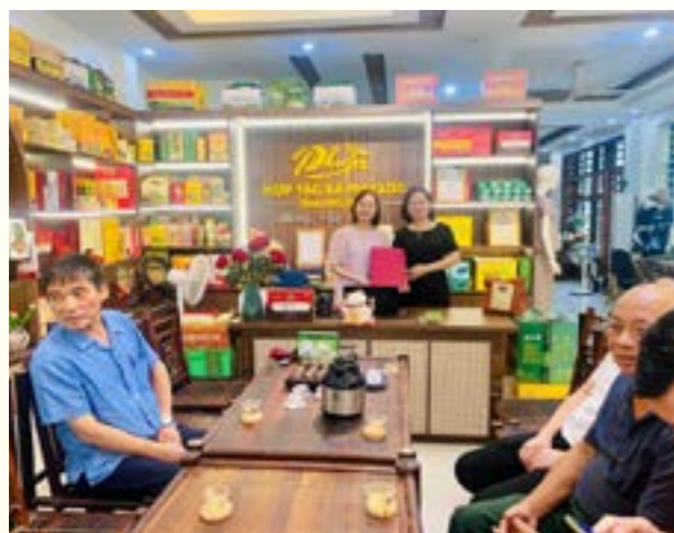
Quảng cảnh buổi làm việc với Trung tâm XTTM Thái Nguyên