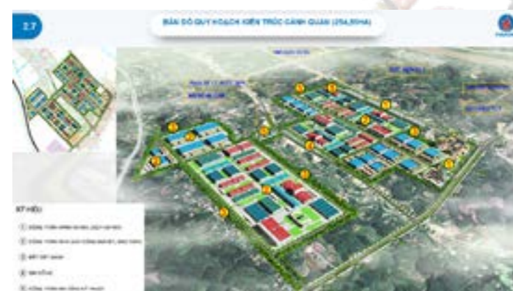
Bản đồ quy hoạch kiến trúc cảnh quan KCN Trấn Yên

trương đầu tư đồng thời chấp thuận nhà đầu tư đối với KCN Trấn Yên đối với Tổng công ty Viglacera- CTCP tại Quyết định số 1438/QĐ-TTg của Thủ tướng Chính phủ: Chủ trương đầu tư dự án đầu tư xây dựng và kinh doanh kết cấu hạ tầng khu công nghiệp Trấn Yên (giai đoạn I), tỉnh Yên Bái); tham mưu UBND tỉnh thành lập CCN Yên Hợp, Y Can, bãi bỏ quyết định thành lập CCN Bảo Hưng, tham gia ý kiến chấp thuận chủ trương đầu tư CCN Bảo Hưng