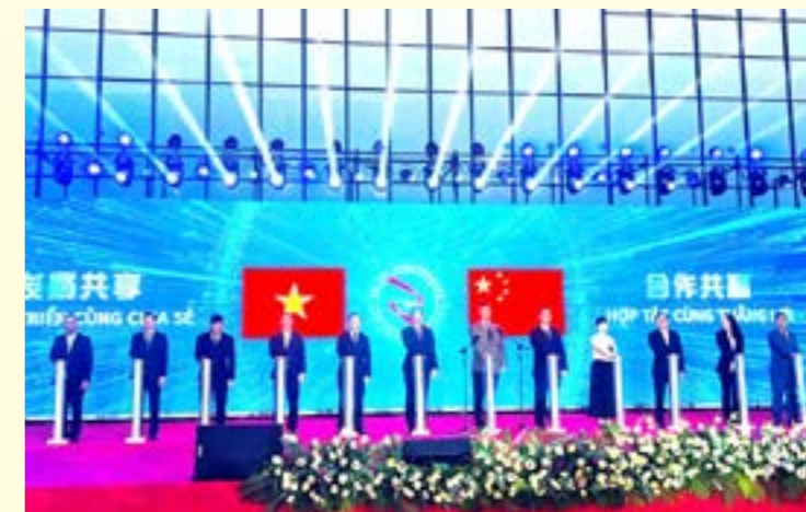
Lãnh đạo tỉnh Yên Bái tham dự khai mạc Hội chợ Kinh tế thương mại và du lịch biên giới Trung - Việt (Hồng Hà) năm 2024.