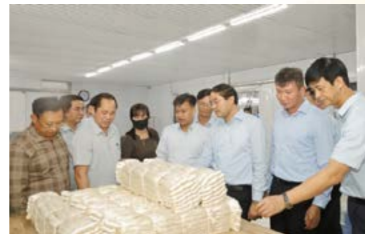
Sản phẩm tơ tằm là một trong số sản phẩm mới của tỉnh Yên Bái xuất khẩu sang thị trường Nhật Bản

Nhằm đồng hành, hỗ trợ DN, ngành Công Thương tỉnh đã tham mưu với UBND tỉnh thành lập tổ công tác, tổ giúp việc tháo gỡ khó khăn, vướng mắc trong quá trình triển khai các dự án điện trên địa bàn tỉnh; tổ chức các đoàn khảo sát, nắm bắt tình hình hoạt động của các DN xuất khẩu. Thành lập đoàn công tác đi nắm tình hình sản xuất kinh doanh và việc chấp hành các quy định của Nhà nước trong đầu tư, quản lý vận hành của các nhà máy thủy điện trên địa bàn.