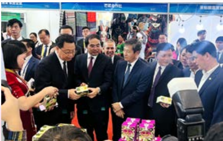
Phó Chủ tịch UBND tỉnh Ngô Hạnh Phúc giới thiệu với các đại biểu về các sản phẩm của tỉnh Yên Bái tham gia Hội chợ

Tham gia Hội chợ thương mại ASEAN - Trung Quốc lần thứ 21 (CAEXPO 2024), tỉnh Yên Bái có 02 gian hàng trưng bày và giới