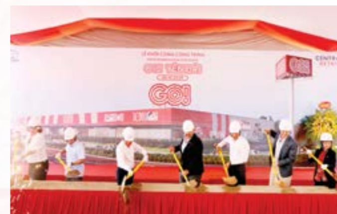
Các đại biểu thực hiện nghi thức động thổ công trình Trung tâm thương mại GO! Yên Bái

Chủ động theo dõi, bám sát diễn biến tình hình giá cả, thị trường, đảm bảo nguồn cung cầu hàng hóa, phối hợp với các ngành, đơn vị tăng cường công tác kiểm tra, kiểm soát thị trường, đặc biệt là mặt hàng kinh doanh xăng dầu. Chủ trì phối hợp tốt với UBND cấp