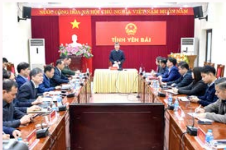
Đồng chí Ngô Hạnh Phúc - Ủy viên Ban Thường vụ Tỉnh ủy, Phó Chủ tịch UBND tỉnh phát biểu tại Hội nghị

Phát biểu khai mạc Hội nghị, đồng chí Ngô Hạnh Phúc - Phó Chủ tịch UBND tỉnh nhấn mạnh: Tỉnh Yên Bái xác định Dự án Đường dây 500kV Lào Cai - Vĩnh Yên là công trình trọng điểm quốc gia, có vai trò rất quan trọng trong