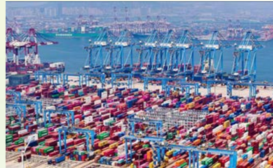
Quang cảnh cảng hàng hóa ở Thanh Đảo, tỉnh Sơn Đông, Trung Quốc ngày 3/7/2024.

B áo cáo của LHQ về Tình hình và Triển vọng kinh tế thế giới 2025 cho biết, mặc dù lạm phát giảm, điều kiện thị trường lao động được cải thiện và việc nới lỏng tiền tệ nói chung, tăng trưởng dự kiến sẽ vẫn ở mức thấp hơn tốc độ trước đại dịch, trong khi nền kinh tế toàn cầu sẽ tiếp tục đối mặt với những bất ổn đáng kể.