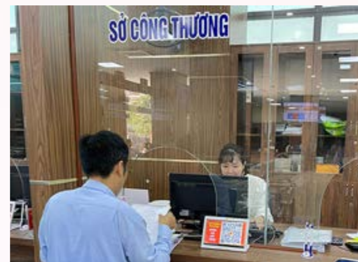
Người dân giải quyết thủ tục hành chính thuộc Sở Công Thương tại Trung tâm Hành chính công tỉnh

Chỉ đạo xây dựng kế hoạch cải cách hành chính và rà soát TTHC năm 2024, đẩy mạnh ứng dụng công nghệ thông tin, sử dụng hiệu quả Hệ thống quản lý điều hành tác nghiệp, hệ thống theo dõi, giám sát, kiểm tra thực hiện nhiệm vụ, nâng cao chất lượng dịch vụ công, rút ngắn thời gian giải quyết các TTHC. Thực hiện tiếp nhận và trả kết quả 100% thủ tục hành chính thuộc thẩm quyền giải quyết của cơ quan tại Trung tâm Phục vụ Hành chính công tỉnh Yên Bái đúng và trước thời hạn. Trong