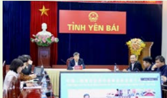
Quang cảnh phiên họp tại điểm cầu tỉnh Yên Bái

Đối với Yên Bái, tháng 3/2020, tỉnh đã được Thủ tướng Chính phủ đồng ý để tỉnh tham gia các phiên họp của Hội nghị với tư cách là một đối tác hợp tác, một địa phương nằm trên tuyến Hành lang kinh tế Côn Minh - Lào Cai - Hà Nội - Hải Phòng - Quảng Ninh. Mặc dù chưa là thành viên chính thức trong tuyến hành lang kinh tế này nhưng trong thời gian qua, các bên đã triển khai nhiều hoạt động hợp tác hữu nghị hiệu quả, thực chất