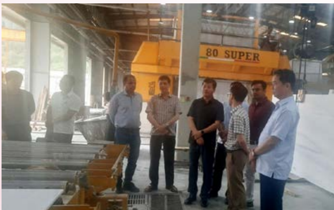
Phó Chủ tịch UBND tỉnh Ngô Hạnh Phúc kiểm tra thực tế, nắm bắt những khó khăn trong hoạt động sản xuất tại Công ty TNHH Đá cẩm thạch R.K Việt Nam

Trong năm đã tổ chức 03 hội nghị tháo gỡ khó khăn cho các doanh nghiệp lĩnh vực khoáng sản (chế biến đá trắng, sắt, đồng, chì kẽm, graphit, than) và lĩnh vực kinh doanh thương mại, dịch vụ); Tổ chức các Hội nghị hỗ trợ các doanh nghiệp sản xuất, phòng vệ thương mại.