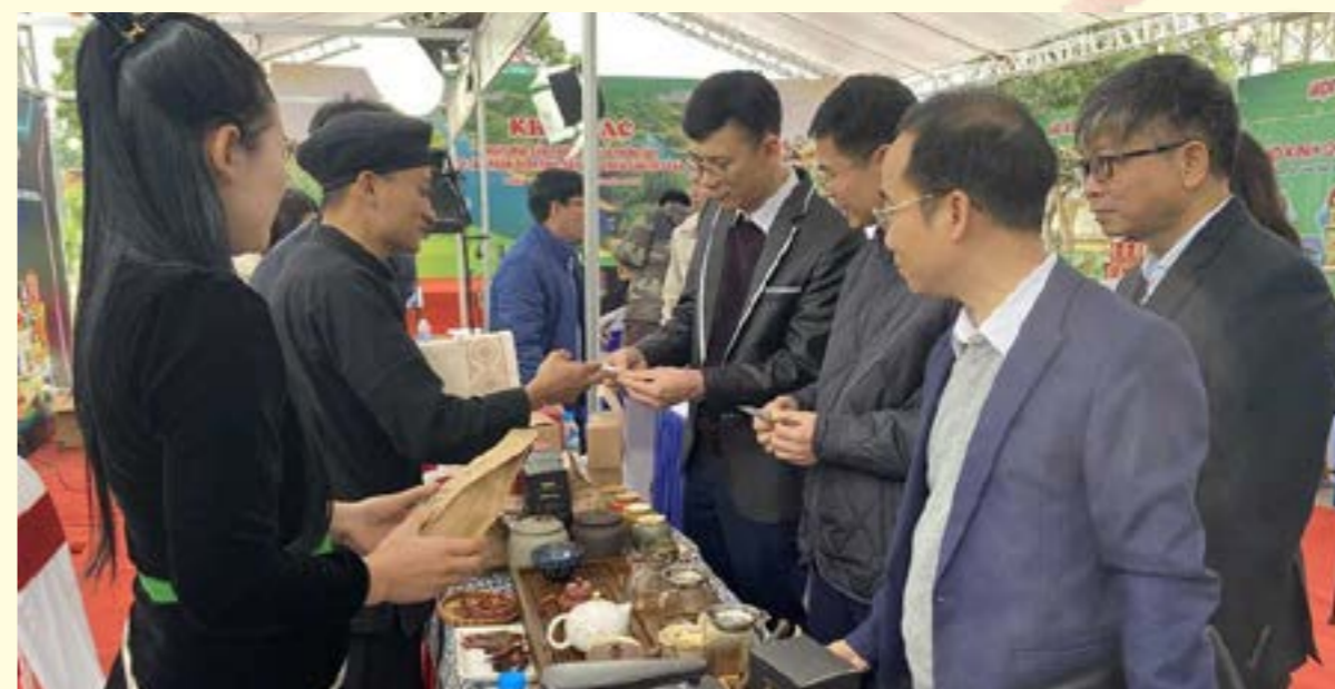
Các đại biểu tham quan gian hàng của các doanh nghiệp tham gia Chương trình

đẩy phát triển kinh tế số năm 2024" có sự tham gia của 30 doanh nghiệp trên địa bàn tỉnh kinh doanh các sản phẩm nông sản, thủy sản và 8 TikToker đến từ huyện Văn Chấn, thị xã Nghĩa Lộ, thành phố Yên Bái và tỉnh Điện Biên. Các TikToker sẽ livestream 4 phiên bán các mặt hàng của các doanh nghiệp tham gia Chương trình.