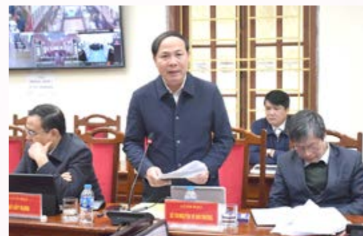
Giám đốc Sở Tài nguyên và Môi trường tuyên truyền về chính sách đền bù, hỗ trợ giải phóng mặt bằng, tái định cư

Tại Hội nghị đã tuyên truyền phổ biến cho cấp ủy, chính quyền các cấp huyện, xã, thôn và bà con nhân dân nơi đường dây đi qua về vai trò, ý nghĩa của dự án; các chính sách, chế độ hiện hành về đền bù GPMB; những ích lợi mang lại đối với kinh tế xã hội của địa phương và tuyên truyền về ý thức chấp hành chủ trương của Đảng, Nhà nước, thực hiện đúng chỉ đạo, điều hành của chính quyền địa phương các cấp trong việc bàn giao mặt