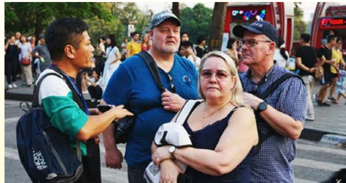
Lượng khách du lịch quốc tế đang có xu hướng tăng so với thời điểm trước dịch Covid-19