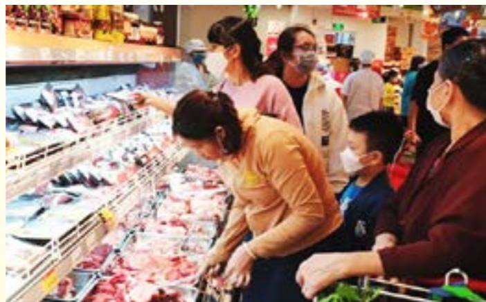
Phục hồi tiêu dùng là xu hướng được dự báo tiếp tục diễn ra trong năm 2025

Tăng trưởng doanh thu bán lẻ thực tế (loại trừ tác động của lạm phát) ước tính khoảng 6% trong năm 2024, thấp hơn mức tăng trưởng 8-9% điển hình ở Việt Nam. Hơn nữa, khoảng một nửa trong con số 6% này là do sự phục hồi liên tục của lượng khách du lịch quốc tế, từ 70% so với trước dịch Covid-19 trong năm 2023 lên 100% vào năm 2024.