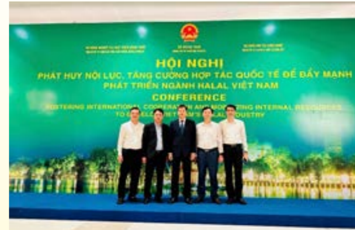
Đoàn đại biểu tỉnh Yên Bái dự Hội nghị “Phát huy nội lực, tăng cường hợp tác quốc tế để đẩy mạnh phát triển ngành Halal Việt Nam” tổ chức ngày 22/10/2024 tại Hà Nội

Đối với sản quế, Yên Bái là tỉnh có vùng quế lớn nhất cả nước với diện tích trên 82 nghìn ha diện tích tập trung, chuyên canh trên 38 nghìn ha, tập trung nhiều ở các huyện Trấn Yên, Văn Chấn, Văn Yên, Lục Yên, Yên Bình; sản lượng khai thác từ quế khoảng 18.061 tấn quế