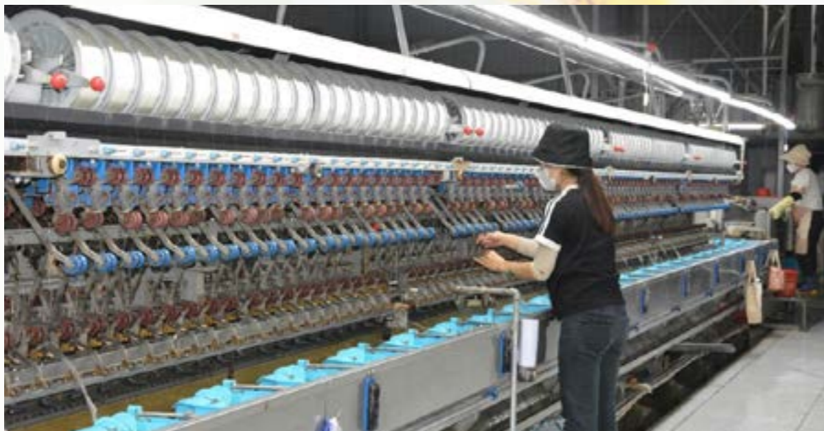
Sản xuất công nghiệp trên địa bàn tỉnh đang dần phục hồi, đạt mức tăng trưởng khá