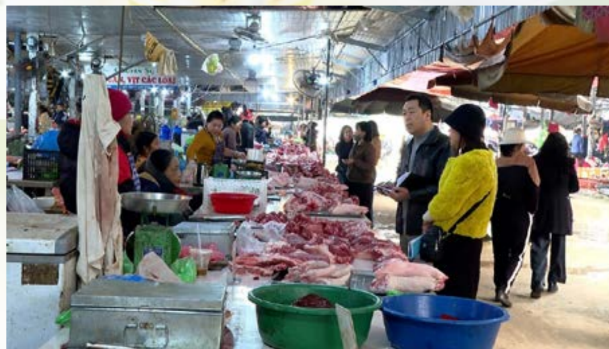
Đoàn công tác của Sở Công Thương nắm bắt tình hình thị trường Tết Ất Tỵ 2025

Để bảo đảm cân đối cung cầu các mặt hàng