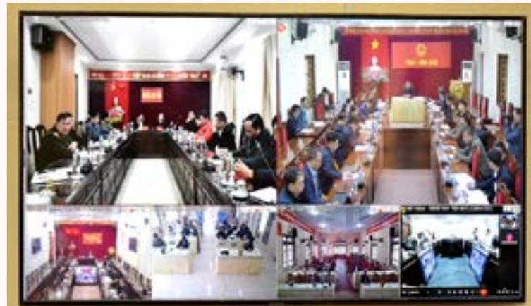
Đại biểu dự Hội nghị tại các điểm cầu

Với quyết tâm chính trị cao trong công tác giải phóng mặt bằng đến nay đã hoàn thành cắm mốc xong 173/173 móng cột, đo đạc địa chính hoàn thành 10/10 xã ở huyện Lục Yên và 13/13 xã và thị trấn huyện Yên Bình, đã bàn giao bản đồ địa chính (bản đồ mộc có chữ ký