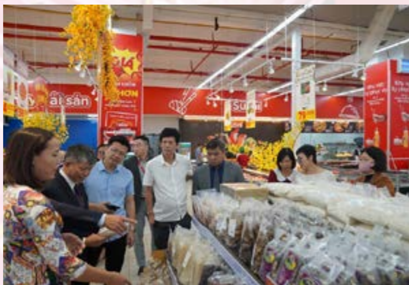
Các đại biểu tham quan khu vực bày bán sản phẩm của tỉnh Yên Bái trong siêu thị GO! Thăng Long