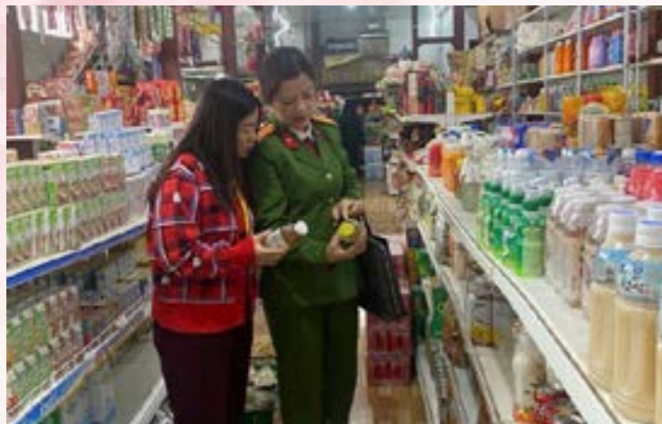
Đoàn kiểm tra liên ngành kiểm tra các cơ sở kinh doanh, cung cấp thực phẩm dịp tết.

các khu trung tâm, chợ, siêu thị tăng cao trong các dịp Tết Nguyên đán Ất tỵ và mùa Lễ hội Xuân 2025. Cùng với nhiều loại thực phẩm, nguyên liệu thực phẩm, phụ gia thực phẩm, chất hỗ trợ chế biến thực phẩm giả, không đảm bảo chất lượng an toàn thực phẩm, không rõ nguồn gốc xuất xứ có thể bị trà trộn vào để tiêu thụ trên thị trường.