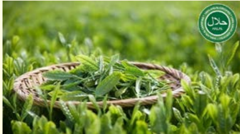
Cùng với các sản phẩm từ quế, chè là sản phẩm có tiềm năng xuất khẩu vào thị trường Halal.

Thực tế cho thấy, tổng diện tích chè của tỉnh hiện có hơn 7.443 ha, tập trung nhiều ở các huyện: Trấn Yên, Văn Chấn, Trạm Tấu, Mù Cang Chải; sản lượng hàng năm đạt trên 69 nghìn tấn. Hiện nay trên địa bàn tỉnh Yên Bái đang xây dựng 1 chuỗi liên kết chè do Công ty TNHH chè Bình Thuận thực hiện với diện tích 281 ha tại 3 xã Bình Thuận, Chấn Thịnh, Nghĩa Tâm - huyện Văn Chấn, liên kết với 321 hộ dân. Vùng sản xuất chè chất lượng cao, chè đặc sản bao gồm Chè Shan 2.033 ha, sản lượng 5.197 tấn, tập trung tại huyện Văn Chấn, Trạm Tấu, Mù Cang Chải; chè nhập nội (giống chè Bát Tiên, Phúc Vân Tiên, Kim Tuyên) 497 ha, sản lượng 3.425 tấn, tập trung tại huyện: Văn Chấn, Văn Yên, Trấn Yên, Lục Yên. Tỉnh hiện có trên 50 cơ sở chế biến, kinh doanh chè, có