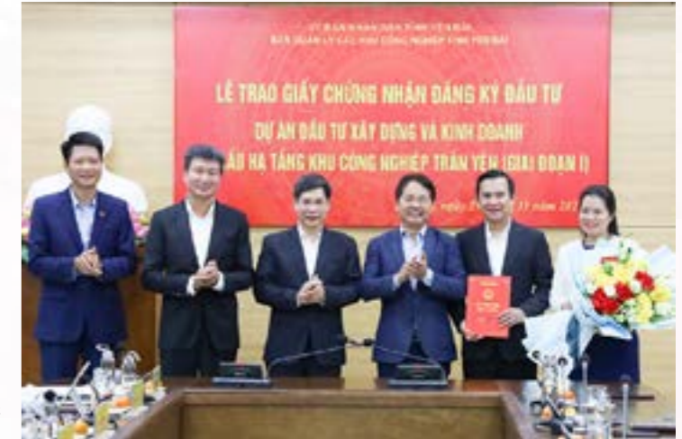
Tỉnh Yên Bái trao Giấy chứng nhận đăng ký đầu tư xây dựng và kinh doanh kết cấu hạ tầng khu công nghiệp Trần Yên (giai đoạn I) cho Tổng Công ty Viglacera - CTCP