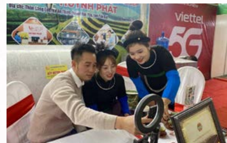
Các doanh nghiệp và Tiktoker cùng livestream bán hàng trực tuyến tại Chương trình

T rong năm đã tham mưu triển khai 05 nội dung phát triển kinh tế số trong năm 2024, các hoạt động tạo chuỗi hỗ trợ phát triển thương mại điện tử trong tổng thể phát triển kinh tế số của tỉnh. Gồm: Tổ chức tập huấn kỹ năng tham gia “Chợ 4.0” cho các tiểu thương của các chợ trên địa bàn tỉnh Yên Bái; Tổ chức chương trình hướng dẫn kỹ năng giới thiệu sản phẩm, bán hàng trực tuyến cho