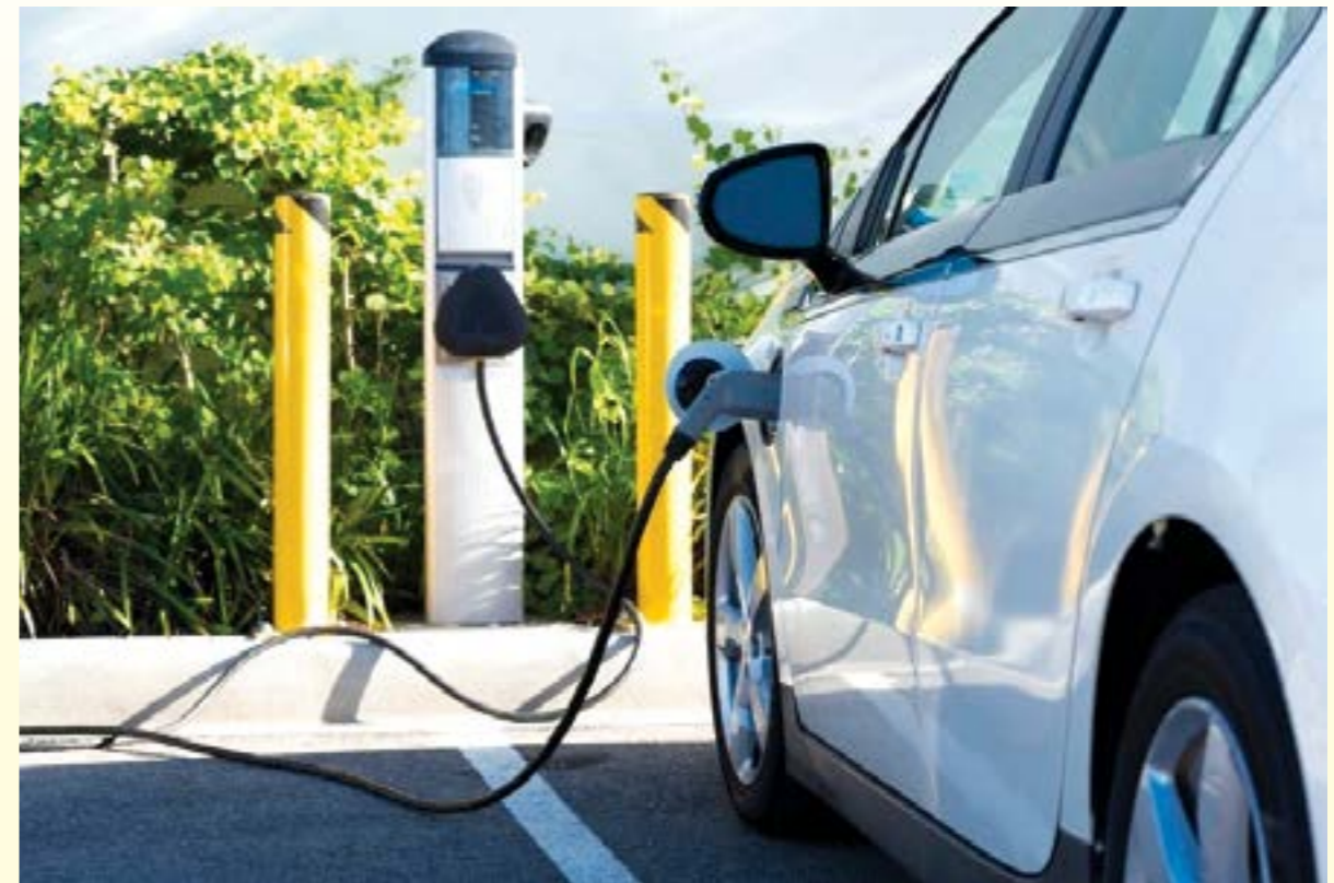
Từ năm 2027, EU sẽ yêu cầu pin xe điện phải có hộ chiếu riêng

Đồng thời, cảnh báo các nhà sản xuất về những thay đổi trong chuỗi cung ứng để họ có thể nắm được tình hình. Hộ chiếu pin hiện tại do Circular phát triển cho xe điện có thể tiết lộ nguồn coban, than chì, lithium, mica và niken được sử dụng trong pin.