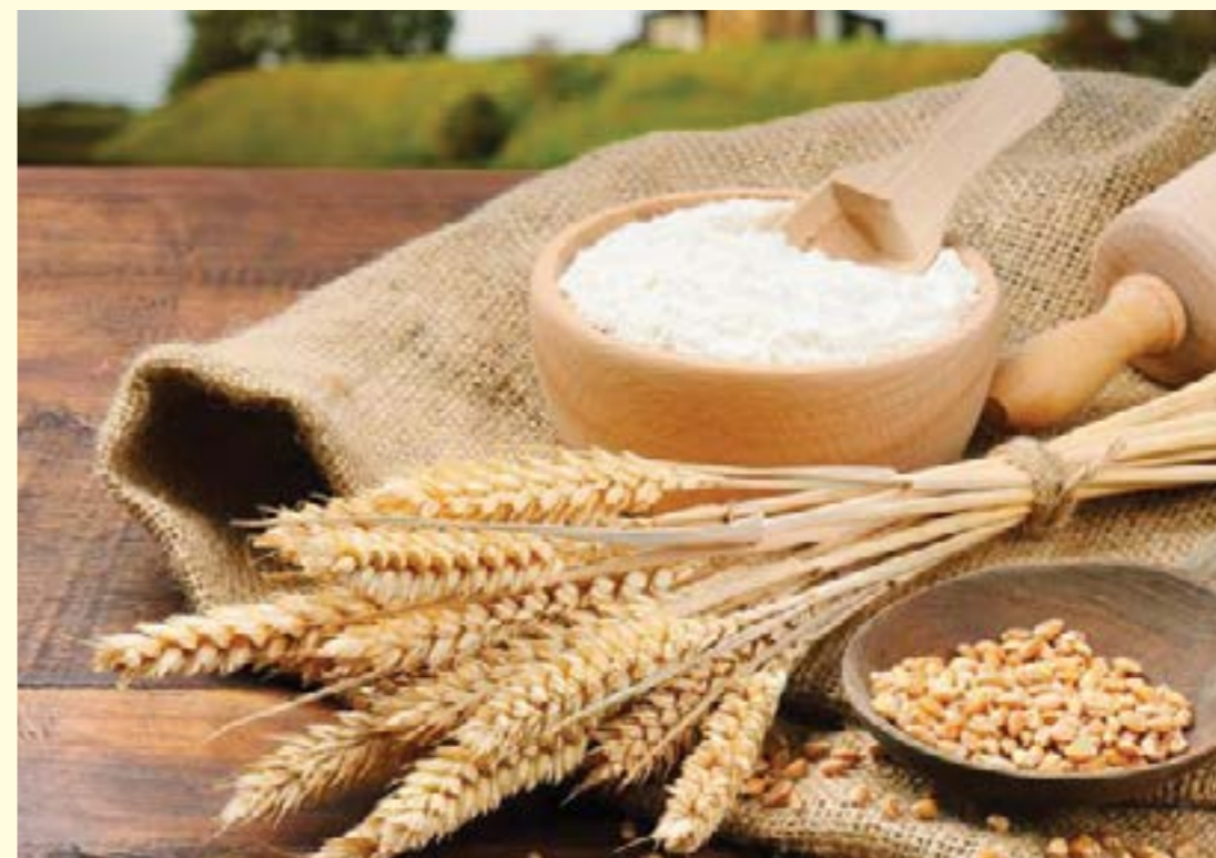
(Ảnh minh họa)

Cùng với đà phát triển của kinh tế, các doanh nghiệp sản xuất thực phẩm cũng bắt đầu nghiên cứu để cho ra mắt những sản phẩm được làm từ bột mì như mì ăn liền, bánh