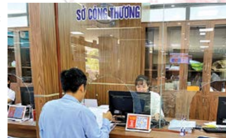
Người dân giải quyết thủ tục hành chính thuộc Sở Công Thương tại Trung tâm Hành chính công tỉnh

Chỉ đạo xây dựng kế hoạch cải cách hành chính và rà soát TTHC năm 2023, đẩy mạnh ứng dụng công nghệ thông tin, sử dụng hiệu quả Hệ thống quản lý điều hành tác nghiệp, hệ thống theo dõi, giám sát, kiểm tra thực hiện nhiệm vụ, nâng cao chất lượng dịch vụ công, rút ngắn thời gian giải quyết các TTHC. Thực hiện tiếp nhận và trả kết quả 100% thủ tục hành chính thuộc thẩm quyền giải quyết của cơ quan tại Trung tâm Phục vụ Hành chính công tỉnh Yên Bái đúng và trước thời hạn. Trong năm 2023, Sở Công Thương đã tiếp nhận 26.951 hồ sơ (tiếp nhận trực tuyến 26.900 hồ sơ; tiếp nhận trực tiếp 22 hồ sơ; từ kỳ trước chuyển sang 29 hồ sơ); đã giải quyết 26.920 hồ sơ (trước hạn 21.183 hồ sơ; đúng hạn 5.737 hồ sơ); đang giải quyết đúng hạn 31 hồ sơ.