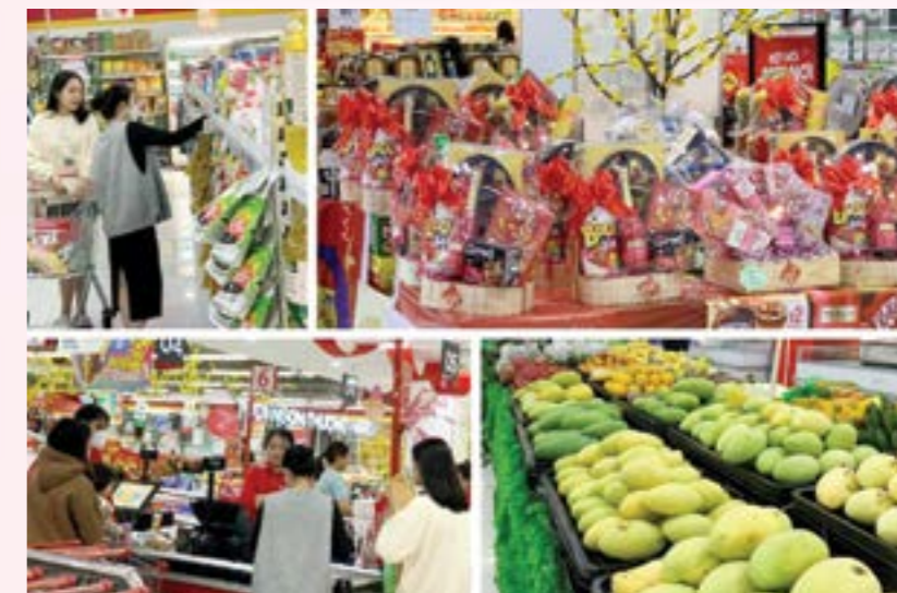
Hàng hóa bày bán ở siêu thị Vincom Yên Bái và Winmart+ trên địa bàn thành phố Yên Bái.