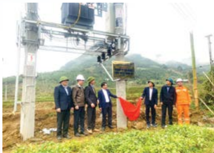
Lễ bàn giao Công trình đường điện Thôn Mắm 2

Sau hơn một tháng thi công, công trình đã hoàn thành đảm bảo tiến độ, chất lượng và đã hoàn thành đóng điện, cấp điện cho người dân sử dụng từ ngày 12/01/2024. Công trình xây dựng “Đường điện cho thôn Mắm 2, xã An Lương, huyện Văn Chấn, tỉnh Yên Bái” đưa vào sử dụng, góp phần giảm bớt khó khăn cho cho nhân dân thôn Mắm 2 để bà con nhân dân có điều kiện