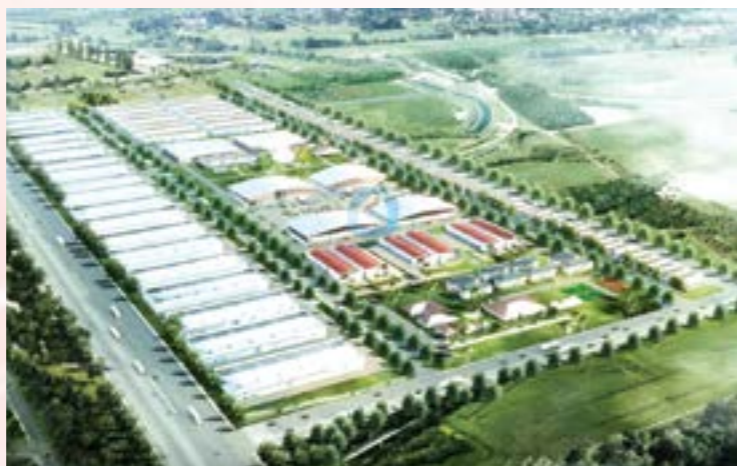
Khu công nghiệp Trãn Yên có diện tích quy hoạch 339 ha (Ảnh minh họa)

Đoàn thành 03 chuyên đề quy hoạch ngành; đề án, Phương án phát triển khu, cụm công nghiệp giai đoạn 2021 - 2030 được tích hợp vào Quy hoạch tỉnh Yên Bái thời kỳ 2021-2030, tầm nhìn đến năm 2050 đã được Thủ tướng Chính phủ phê duyệt tại Quyết định số 1086/QĐ-TTg ngày 18/9/2023. Tham mưu ban hành Chương trình hành động số 158-CTr/TU ngày 14/5/2023 của Tỉnh ủy triển khai thực hiện Nghị quyết số 29-NQ/TW ngày 17/11/2022 của BCH TW Đảng khóa XIII về tiếp tục đẩy mạnh công nghiệp hoá, hiện đại hoá đất nước đến năm 2030, tầm nhìn đến năm 2045; Kế hoạch số 229/KH-UBND ngày 15/11/2023 của Ủy ban nhân dân tỉnh thực hiện Quyết định số 165/QĐ-TTg