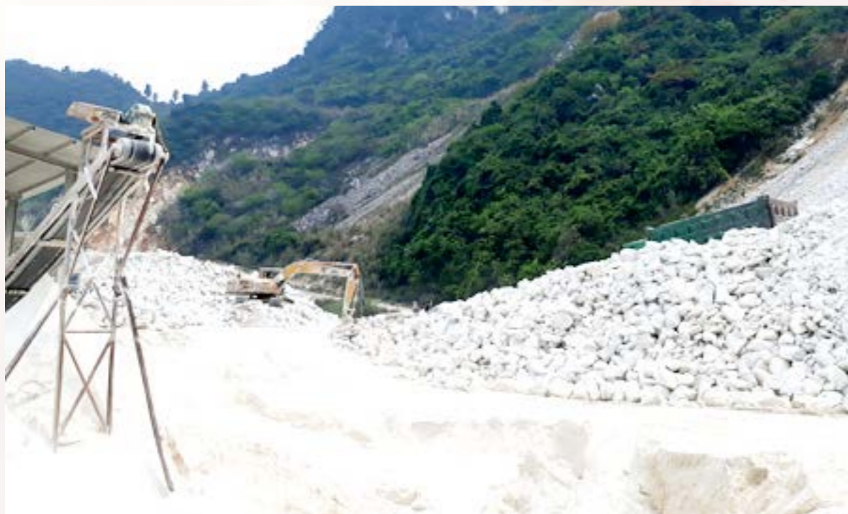
Khai thác đá trắng tại xã Mông Sơn, huyện Yên Bình

và sử dụng VLNCN. Tuy nhiên, bên cạnh đó vẫn còn một số tồn tại, hạn chế, khó khăn như: Địa bàn quản lý rộng, lực lượng quản lý nhà nước về vật liệu nổ công nghiệp còn mỏng khó có thể nắm bắt được toàn diện hết các hoạt động vật liệu nổ công nghiệp của các doanh nghiệp; việc báo cáo tình hình sử dụng VLNCN của các doanh nghiệp chưa thường xuyên; chế tài xử lý vi phạm hành chính trong lĩnh vực VLNCN chưa thật sự mang tính răn đe... đây là những nguyên nhân chính gây nên những khó khăn không nhỏ cho công tác quản lý nhà nước. Mặt khác, ý thức chấp hành pháp luật của một số doanh nghiệp trong