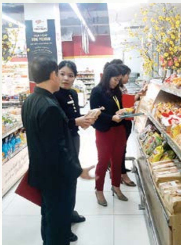
Đoàn kiểm tra liên ngành kiểm tra các cơ sở kinh doanh, cung cấp thực phẩm dịp tết.

Trước thực trạng trên, để thực hiện tốt việc sản xuất, kinh doanh thực phẩm đảm bảo an toàn theo qui định của pháp luật trên địa bàn, Ủy ban nhân dân tỉnh đã ban hành Quyết định số 33/QĐ-UBND ngày 9/01/2024 về việc thành lập đoàn kiểm tra liên ngành về ATTP dịp Tết Nguyên đán Giáp Thìn và mùa Lễ hội Xuân 2024; đồng thời Ban Chỉ đạo đã triển khai Kế hoạch và thành lập Đoàn kiểm tra liên ngành về ATTP trong dịp Tết Nguyên đán Giáp Thìn và mùa Lễ hội Xuân 2024 sẽ tổ chức các đoàn kiểm tra các cơ sở sản xuất, kinh doanh từ ngày 10/01/2024 đến ngày 25/02/2024 trên địa bàn toàn tỉnh Yên Bái.