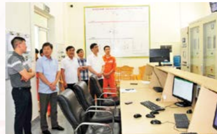
Đoàn công tác của Lãnh đạo tỉnh nắm bắt, tháo gỡ khó khăn cho doanh nghiệp thủy điện

Trong năm 2023 đã tham mưu với UBND tỉnh thành lập tổ công tác, tổ giúp việc tổ công tác tháo gỡ khó khăn, vướng mắc trong quá trình triển khai các dự án điện trên địa bàn tỉnh; tổ chức các đoàn khảo sát, nắm bắt tình hình hoạt động của các doanh nghiệp xuất khẩu;