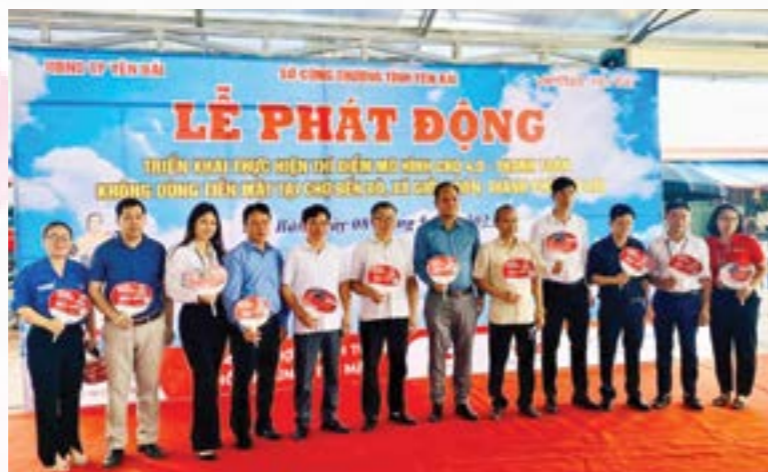
Các đại biểu dự Lễ phát động thực hiện thí điểm mô hình chợ 4.0 tại chợ Bến Đò, xã Giới Phiên, thành phố Yên Bái.

Đ phối hợp với UBND thành phố Yên Bái, Viettel Yên Bái, UBND xã Giới Phiên, Ban Quản lý chợ thành phố Yên Bái và các đơn vị liên quan tổ chức Lễ phát động triển khai thực hiện thí điểm mô hình chợ 4.0 - chợ thanh toán không dùng tiền mặt tại chợ Bến Đò năm 2023.