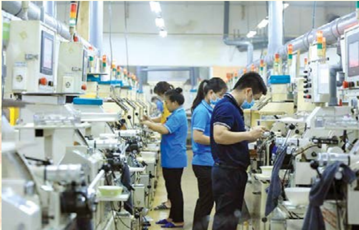
Luật Công nghiệp trọng điểm cũng tạo động lực mới cho doanh nghiệp, thông qua các chính sách ưu đãi, hỗ trợ và khuyến khích doanh nghiệp hoạt động trong các ngành công nghiệp trọng điểm

B ộ Công Thương đang đề nghị xây dựng Luật Công nghiệp trọng điểm nhằm hướng đến xây dựng nền công nghiệp độc lập, tự chủ, tự cường, góp phần phát triển kinh tế nhanh và bền vững, trở thành nước phát triển, có thu nhập cao theo định hướng xã hội chủ nghĩa.