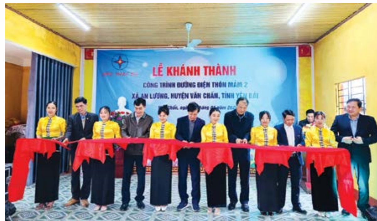
Các đại biểu cắt băng khánh thành công trình đường điện thôn MẨM 2

Sau khi nhận được các văn bản đề nghị cấp điện của xã An Lương và UBND huyện Văn Chấn,