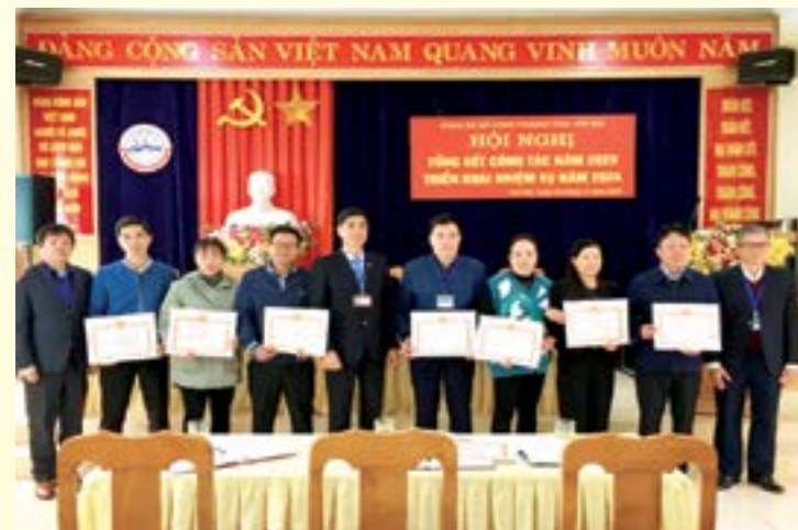
Ban thường vụ Đảng ủy Sở Công Thương tặng giấy khen cho các đồng chí đảng viên hoàn thành xuất sắc nhiệm vụ năm 2023.

được hiệu quả thúc đẩy hoạt động sản xuất kinh doanh, tiêu thụ sản phẩm của các doanh nghiệp. Chỉ đạo triển khai hiệu quả Chương trình xúc tiến thương mại và kế hoạch phát triển thương mại điện tử, đến nay hoàn thành 100% các nội dung trong Chương trình xúc tiến thương mại theo kế hoạch năm 2023. Hoàn thành các đề án XTTM hỗ trợ các doanh nghiệp với tổng kinh phí: 3.325 triệu đồng bằng 100% kế hoạch, trong đó: nguồn địa phương: 2.500 triệu đồng; nguồn Trung ương: 825 triệu đồng. Thông qua đó đã hỗ trợ kết nối, giới thiệu doanh nghiệp chèn trong tỉnh tới Thương vụ Việt Nam tại Hoa Kỳ và các tổ chức XTTM trong và ngoài nước để tìm kiếm thị trường; xúc tiến bán hàng tiêu thụ sản phẩm và ký kết được các hợp đồng, biên bản ghi nhớ với các đối tác trong nước (Hải Dương, Hải Phòng, Quảng Ninh, Ninh Bình, Lào Cai, Hà Nội...) và quốc tế (Trung Quốc, Nhật Bản, Campuchia; Hoa Kỳ, Hàn Quốc; Malaixia...).