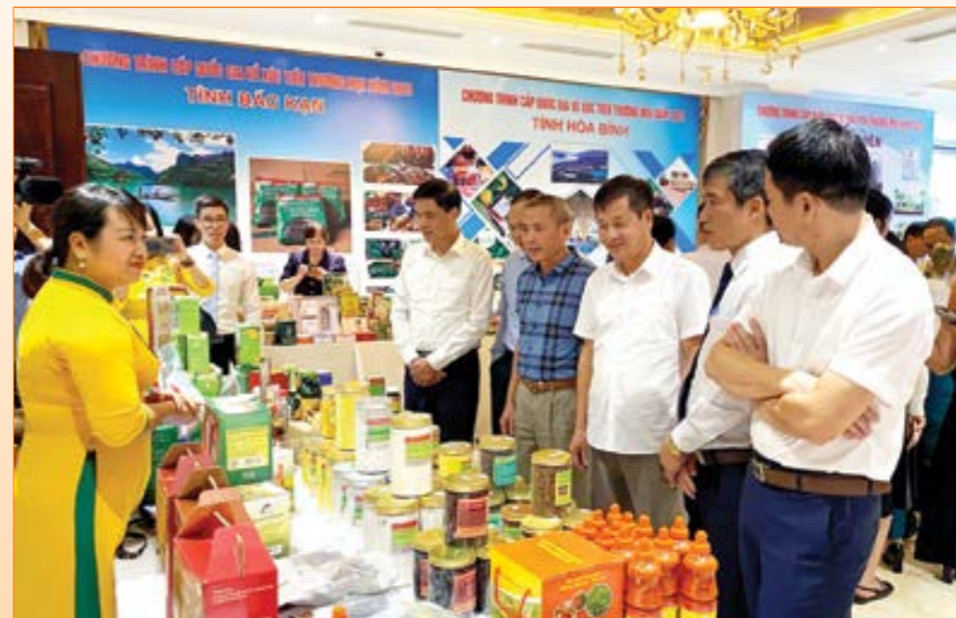
Đồng chí Ngô Hạnh Phúc - Phó Chủ tịch UBND tỉnh cùng các đại biểu tham quan gian trưng bày các sản phẩm tiêu biểu của các địa phương tại Hội nghị Kết nối giao thương giữa nhà cung cấp khu vực Tây Bắc với các doanh nghiệp xuất khẩu năm 2023