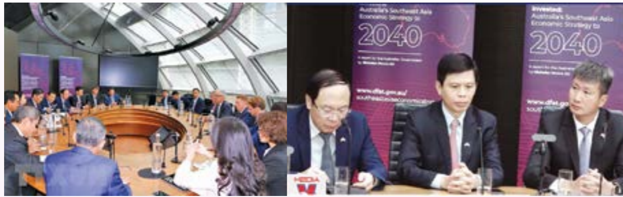
Đoàn đại biểu cấp cao Đảng Cộng sản Việt Nam làm việc với đặc phái viên của Chính phủ Australia về Đông Nam Á Nicholas Moore