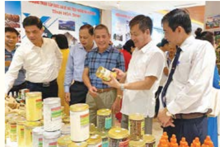
Đồng chí Ngô Hạnh Phúc - Phó Chủ tịch UBND tỉnh cùng các đại biểu tham quan gian trưng bày các sản phẩm tiêu biểu của các địa phương

tốt phục vụ các nhà máy chế biến. Đồng thời đa dạng hóa các loại hình xúc tiến thương mại trong và ngoài nước. Bên cạnh đó, các tỉnh sẽ đẩy mạnh nghiên cứu nắm bắt nhu cầu doanh nghiệp để hỗ trợ bằng các loại hình xúc tiến phù hợp; tăng cường, đẩy mạnh thực hiện chuyển đổi số trong thực hiện các hoạt động xúc tiến thương mại.