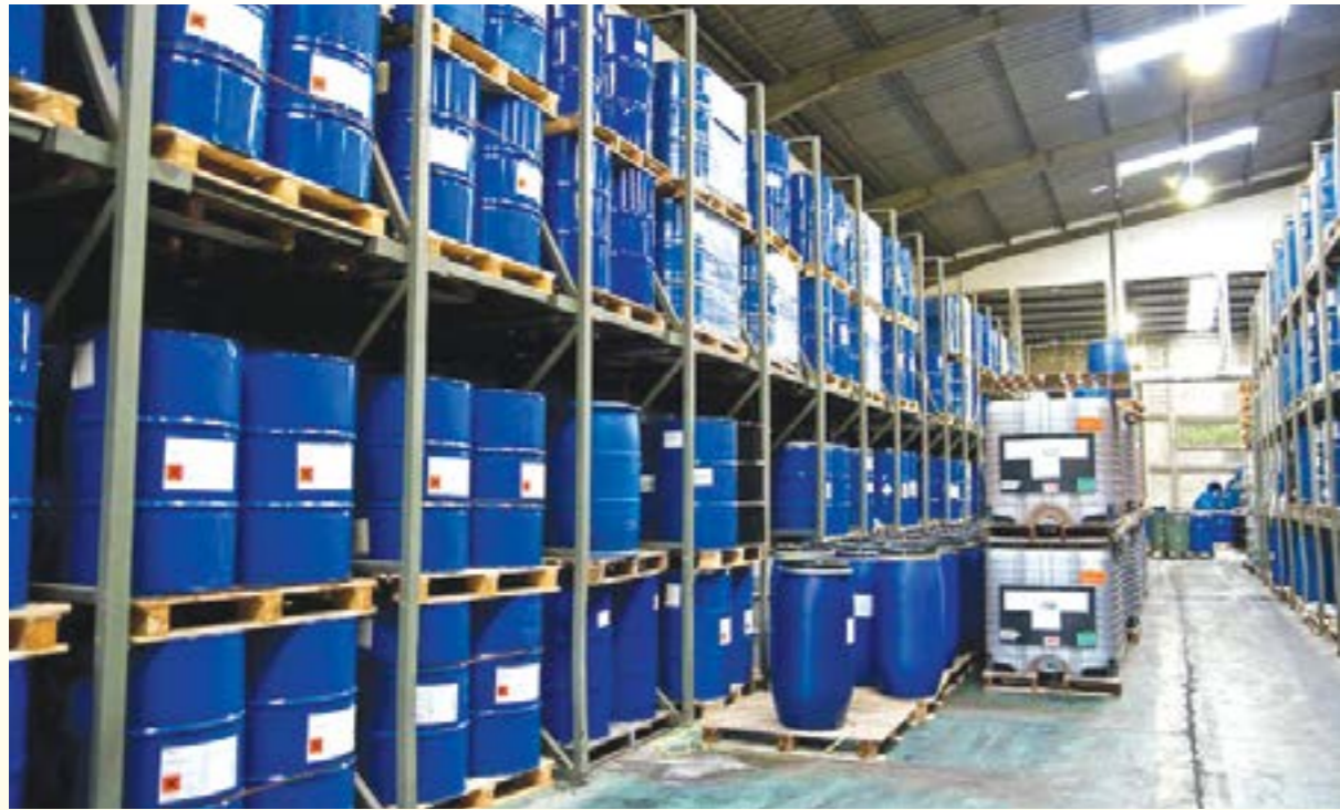
(Ảnh minh họa)

nhằm nâng cao chất lượng công tác quản lý an toàn trong hoạt động sản xuất, kinh doanh, sử dụng hóa chất trong lĩnh vực công nghiệp, Sở Công Thương Yên Bái đã triển khai nhiều hoạt động rà soát, tuyên truyền, kiểm tra để tăng cường công tác phòng ngừa, ứng phó sự cố hóa chất trên địa bàn tỉnh, như: