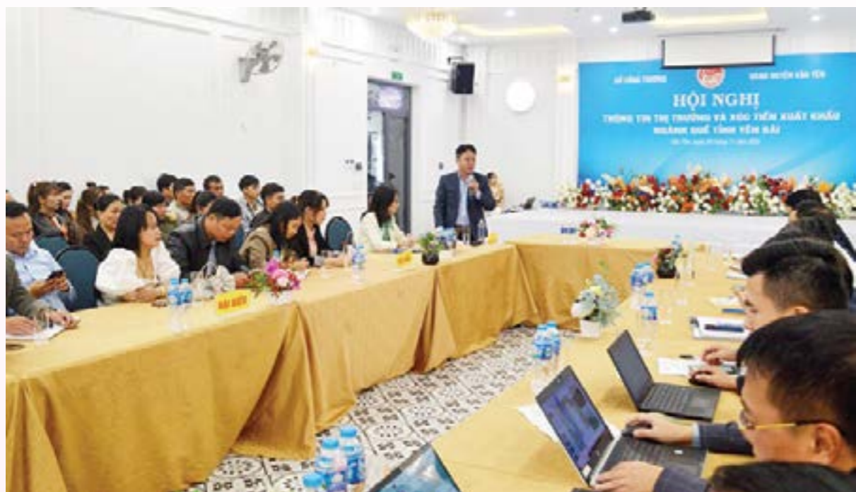
Lãnh đạo Sở Công Thương tỉnh Yên Bái cho biết sẽ tăng cường tìm kiếm, mở rộng thị trường cho các doanh nghiệp quê