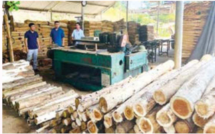
Toàn tỉnh Yên Bái hiện có khoảng 520 cơ sở kinh doanh chế biến lâm sản