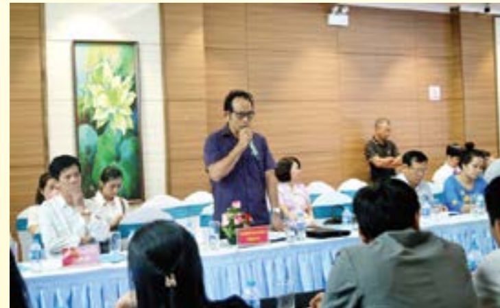
Giám đốc Công ty TNHH Chè Hữu Hào chia sẻ về các tiêu chuẩn xuất khẩu sản phẩm chè

Tại hội nghị, đại diện Sở Công Thương các tỉnh Tây Bắc cho rằng dưới tác động của dịch covid và ảnh hưởng của địa chính trị, xu hướng tiêu dùng đặt ra nhiều thách thức đối với công tác xúc tiến thương mại. Do đó, các tỉnh Tây Bắc sẽ tiếp tục hỗ trợ doanh nghiệp đẩy mạnh công nghệ, thúc đẩy liên doanh, liên kết. Tập trung rà soát các chính sách trong việc kêu gọi các nhà đầu tư, tạo môi trường thực sự thông thoáng cho doanh nghiệp; phát triển trồng và chế biến các loại nông sản và liên doanh liên kết trong sản xuất để ổn định đầu vào với chất lượng