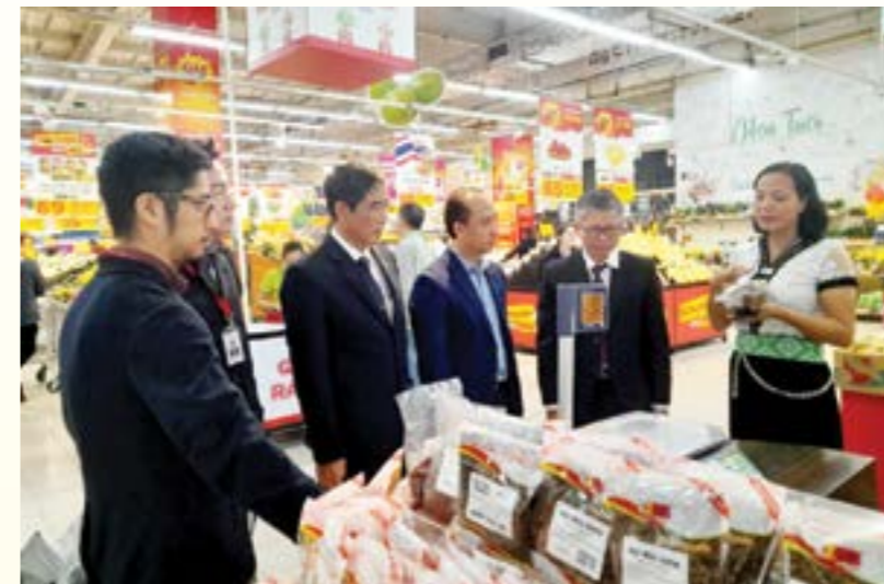
Các đại biểu tham quan gian hàng bày bán sản phẩm nông sản của tỉnh Yên Bái tại siêu thị Big C

vùng miền của Yên Bái; đa dạng hóa sản phẩm OCOP gắn với du lịch địa phương; mà còn là cơ hội giúp các doanh nghiệp tiếp cận thị trường, lắng nghe ý kiến đóng góp của người tiêu dùng từ đó có phương án cải tiến, nâng cao chất lượng, tạo dựng vị trí bền vững cho các sản phẩm của tỉnh trên thị trường; đặc biệt