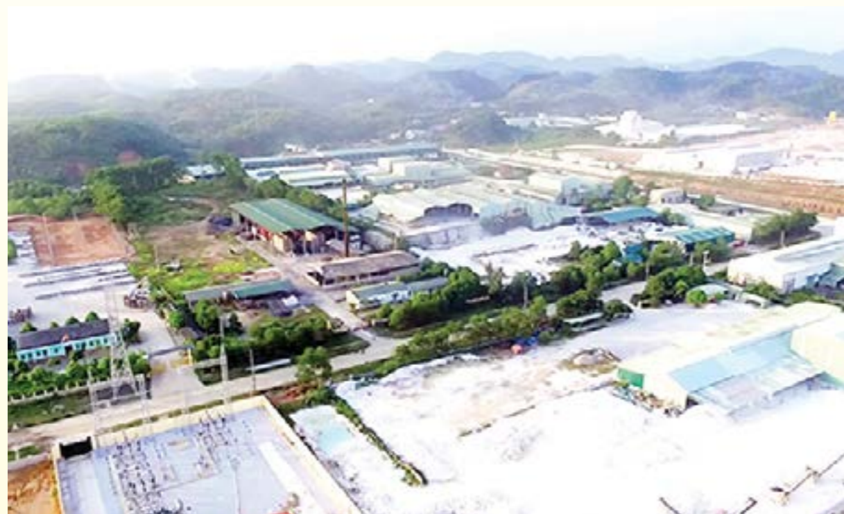
Chủ đầu tư Cụm công nghiệp Phú Thịnh 3 có địa chỉ trụ sở chính tại Khu công nghiệp phía Nam, xã Văn Phú, thành phố Yên Bái.