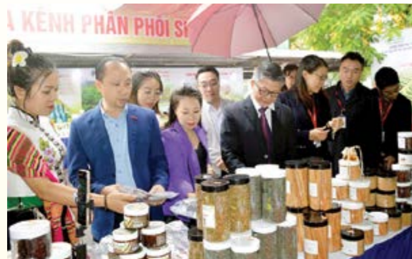
Các đại biểu tham quan và trải nghiệm các sản phẩm nông sản, thủy sản của tỉnh Yên Bái