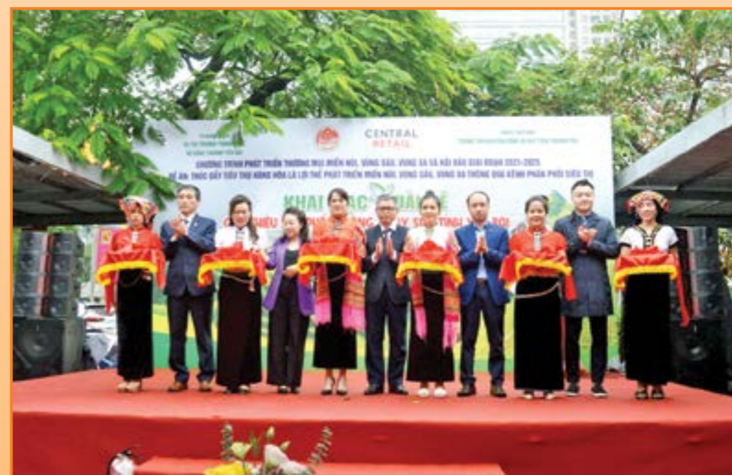
Các đại biểu cắt băng khai mạc Tuần lễ giới thiệu hàng nông, thủy sản tỉnh Yên Bái năm 2023 tại Hà Nội