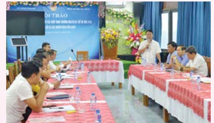
Lãnh đạo Sở Công Thương phát biểu tại hội thảo

Để tháo gỡ khó khăn, thúc đẩy xuất khẩu trong thời gian tới, ngành Công Thương cũng mong muốn các ngành, các cấp và cộng đồng doanh nghiệp đẩy mạnh ứng dụng công nghệ cao, nâng cao hiệu quả chương trình xúc tiến thương mại bằng nhiều hình thức; có chính sách khuyến khích doanh nghiệp đầu tư vào các dự án sản xuất theo chuỗi từ sản xuất nguyên liệu đến chế biến và xuất khẩu; tăng cường tuyên truyền phổ biến kiến thức chuyên sâu về các hiệp định thương mại tự do thế hệ mới. Tiếp tục cải cách, cắt giảm thủ tục hành chính, tạo điều kiện cho doanh nghiệp phát triển cùng với đó nghiên cứu xây dựng các sản phẩm du lịch - dịch vụ gắn với những mặt hàng xuất khẩu.