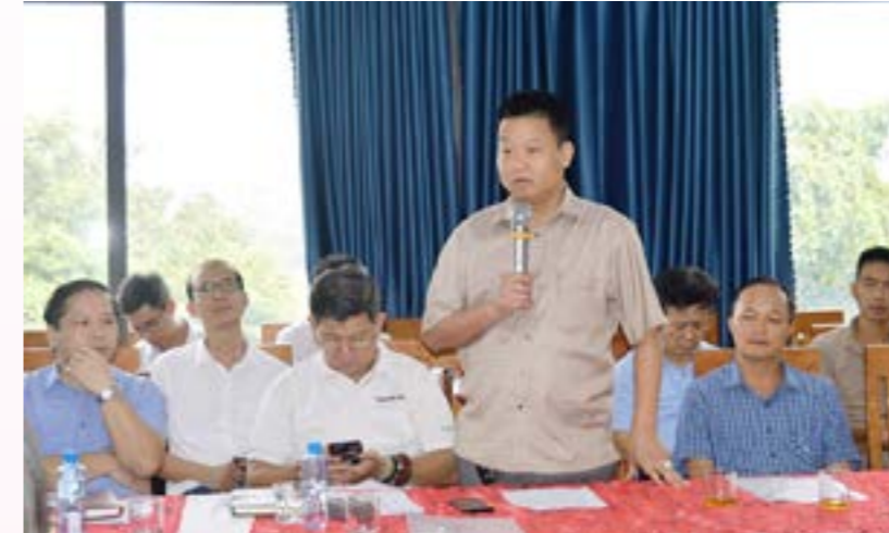
Giám đốc Công ty TNHH Sản xuất thương mại Đạt Phương, xã Việt Cường, huyện Trấn Yên đề nghị tháo gỡ khó khăn về vấn đề hoàn thuế VAT

Tại hội thảo đại diện Vụ Chính sách thương mại Đa biên, Bộ Công Thương đã nêu rõ các vấn đề doanh nghiệp tỉnh đang gặp phải trong quá trình tận dụng các FTA; cơ hội, thách thức khi Việt Nam thực thi và tham gia nhiều hơn các FTA; giải pháp và định hướng của Bộ Công Thương giúp cho doanh nghiệp của tỉnh tận dụng tốt hơn các FTA; kế hoạch xử lý các vấn đề tồn tại của ngành gỗ hiện nay. Trong khuôn khổ của hội thảo, các doanh