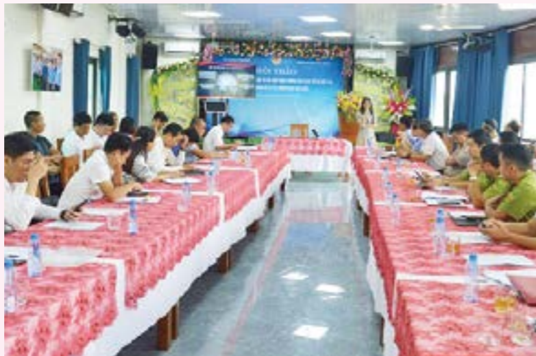
Đại diện Vụ Chính sách thương mại đa biên, Bộ Công Thương thông tin về giải pháp và định hướng của Bộ Công Thương giúp cho doanh nghiệp của tỉnh tận dụng tốt hơn các FTA

Hiện nay Việt Nam đã và đang thực hiện 17 Hiệp định thương mại tự do (FTA) với các khu vực, đối tác trên thế giới. Đặc biệt trong thời gian 3 năm trở lại đây, Việt Nam đã tham gia vào nhiều FTA thế hệ mới với quy mô lớn. Bước đầu đã có doanh nghiệp Yên Bái xuất khẩu hàng hóa vào thị trường các nước này, song còn rất khiêm tốn và hầu như chưa tận dụng được các ưu đãi, lợi thế từ các hiệp định thương mại tự do để khai thác, mở rộng thị trường và đẩy mạnh xuất khẩu.