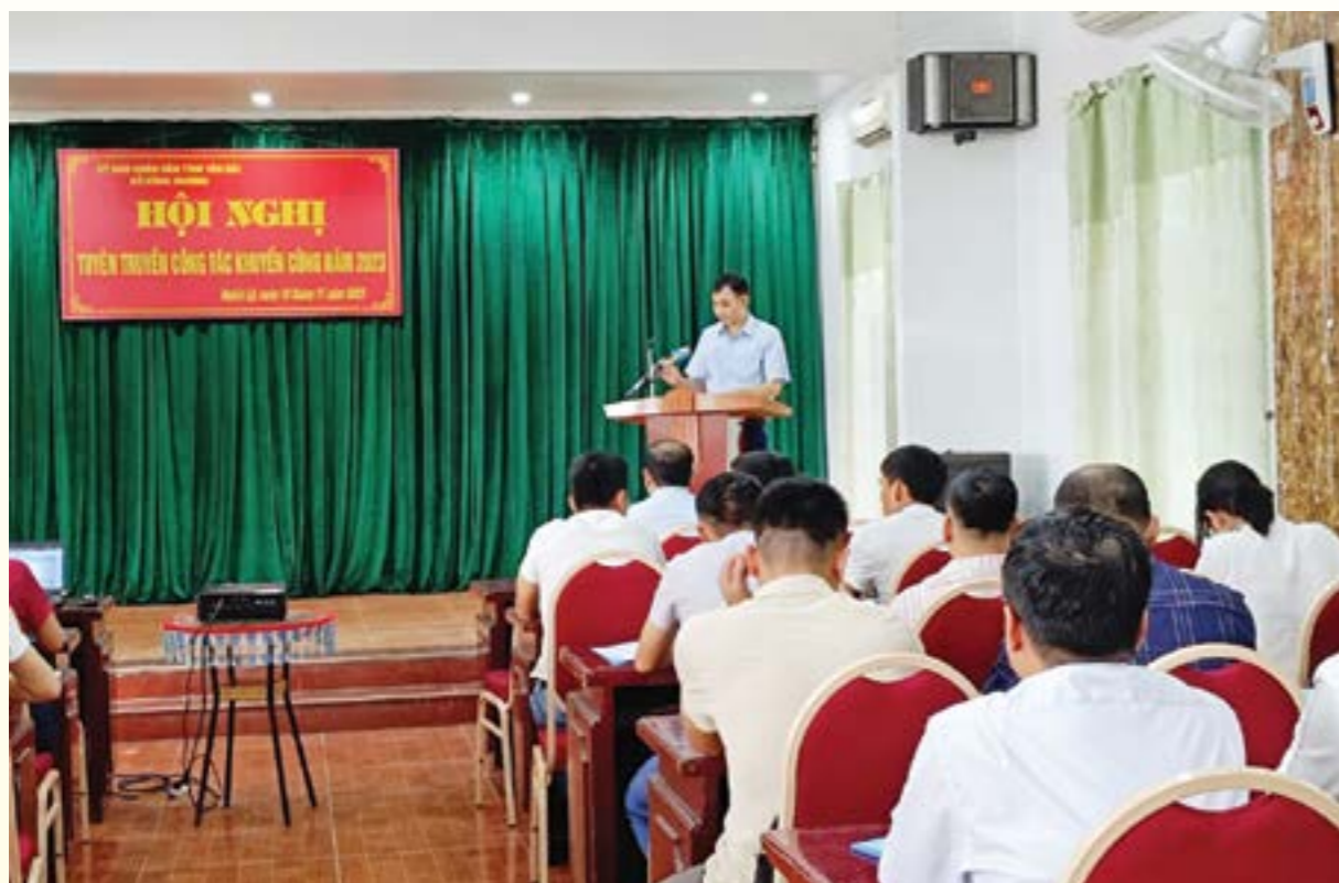
(Quang cảnh hội nghị)

sản phẩm, hàng hóa, phát huy lợi thế các nguồn lực tại địa phương..., góp phần chuyển dịch cơ cấu kinh tế theo hướng công nghiệp hóa, giải quyết việc làm và tăng thu nhập cho người dân nông thôn.