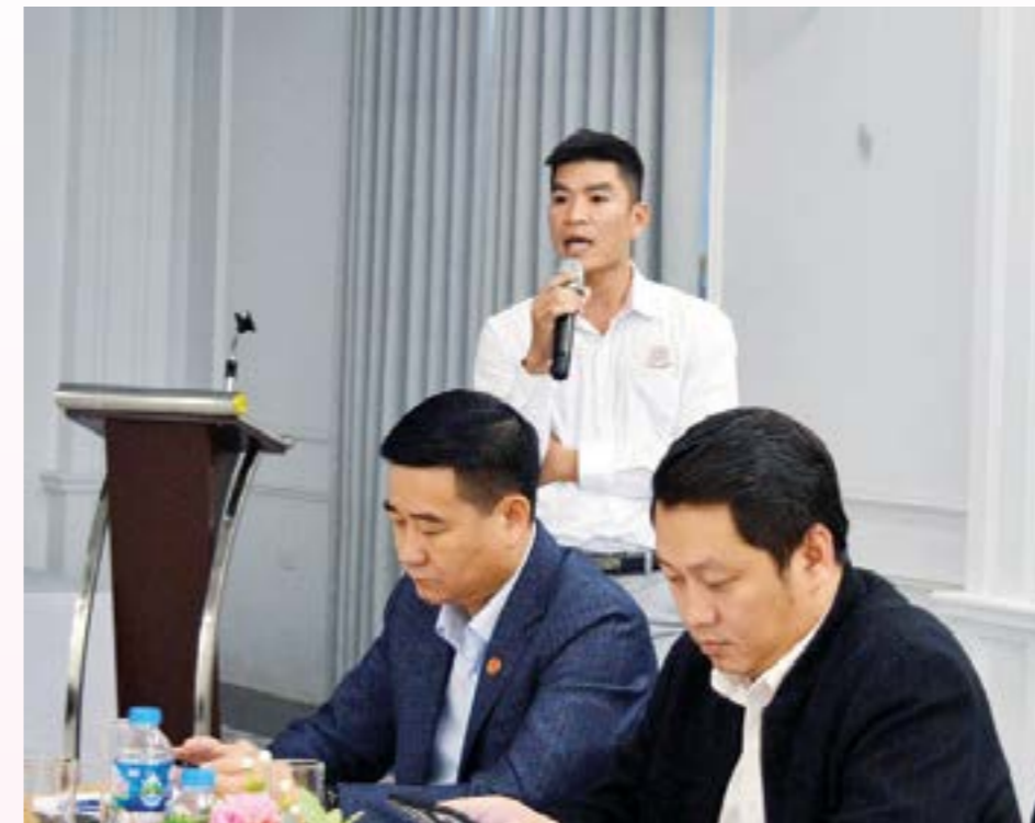
Đại diện HTX Quế hồi Trấn Yên cho rằng khó khăn của sản xuất quế hữu cơ là duy trì ổn định nguồn nguyên liệu

tích quế hữu cơ đạt chứng nhận 7.281 ha. Trên địa bàn huyện Văn Yên có 212 cơ sở, hộ gia đình sản xuất, kinh doanh giống quế. Hằng năm, riêng huyện Văn Yên gieo ươm trên 40 đến 50 triệu cây giống quế, cung ứng cho các địa phương trong và ngoài huyện. Tổng sản lượng quế vỏ khô đạt trên 6.000 tấn/năm, sản xuất lá quế trung bình 65.500 tấn/năm, sản