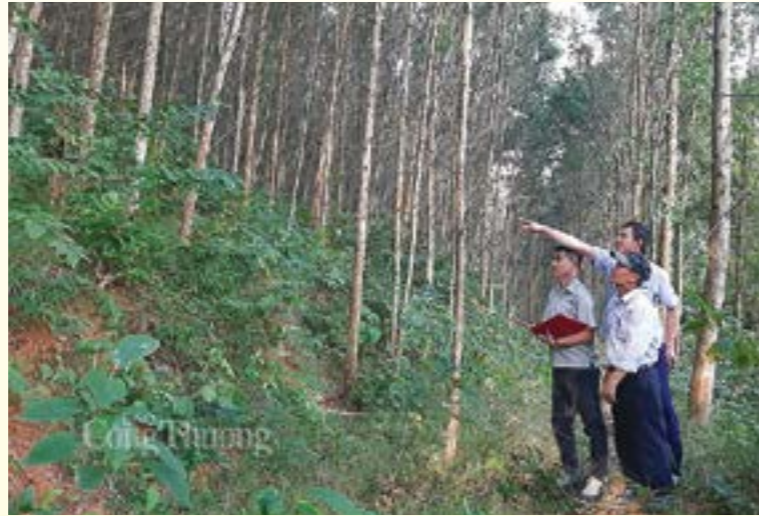
Khu rừng trồng được cấp chứng chỉ FSC tại Nghệ An