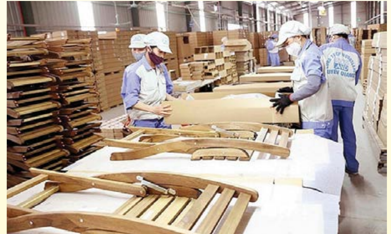
Việt Nam tăng xuất khẩu gỗ và sản phẩm gỗ có chứng chỉ

“Nguồn gỗ trong nước không đủ cho nhu cầu sản xuất đồ gỗ xuất khẩu và cũng chưa có chứng chỉ FSC-FM; trong khi theo yêu cầu của châu Âu và Hoa Kỳ, phải sử dụng 70% nguyên liệu có