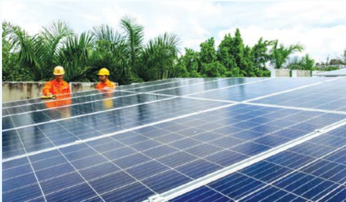
Cần thiết xây dựng cơ chế khuyến khích phát triển điện mặt trời mái nhà

Thúc đẩy phát triển điện mặt trời mái nhà để tạo nguồn năng lượng sạch, giảm phát thải khí nhà kính, bổ sung thêm nguồn cung cấp tại chỗ góp phần giảm tổn thất điện năng trong hệ thống lưới điện, đồng thời các cơ quan quản lý có thể theo dõi việc đầu tư phát triển điện mặt trời mái nhà, không để xảy ra trường hợp phát triển điện mặt trời mái nhà mà không đảm bảo tuân thủ các quy định.