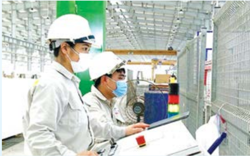
Tỉnh Yên Bái phấn đấu đến năm 2030, tốc độ tăng tổng sản phẩm trên địa bàn (GRDP) bình quân đạt 8,5%/năm

Ủy ban nhân dân tỉnh vừa ban hành kế hoạch số 84/KH-UBND thực hiện Chương trình hành động số 158-CTr/TU ngày 14/5/2023 của Tỉnh ủy Yên Bái triển khai thực hiện Nghị quyết số 29-NQ/TW ngày 17/11/2022 của Ban Chấp hành Trung ương Đảng khóa XIII về tiếp tục đẩy mạnh công nghiệp hóa, hiện đại hóa đất nước đến năm 2030, tầm nhìn đến năm 2045. Theo kế hoạch,