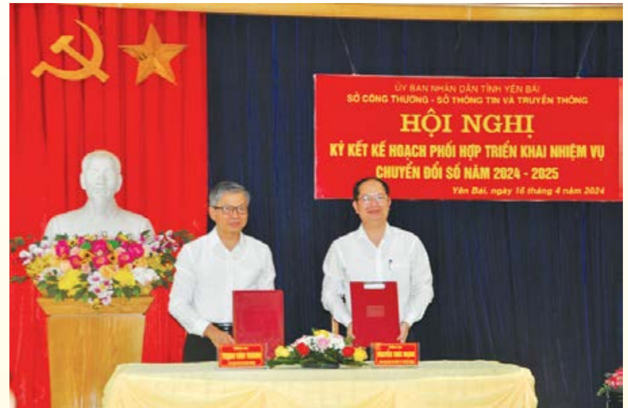
Sở Công thương - Sở Thông tin và Truyền thông ký kết kế hoạch phối hợp

nhiệm vụ đề ra. Trong đó, phối hợp triển khai hiệu quả các nhiệm vụ chuyển đổi số theo nhiệm vụ, quyền hạn, phạm vi, lĩnh vực quản lý và nhiệm vụ được giao của Sở Công thương, Sở Thông tin và Truyền thông; Phối hợp xây dựng các chuyên mục, nội dung tuyên truyền