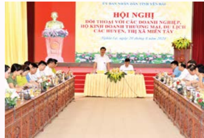
Đồng chí Ngô Hạnh Phúc - Ủy viên Ban Thường vụ Tỉnh ủy, Phó Chủ tịch UBND tỉnh phát biểu tại Hội nghị

Đồng thời hướng dẫn, hỗ trợ các doanh nghiệp, HTX, cơ sở sản xuất kinh doanh tham gia các sản giao dịch thương mại điện tử uy tín trong và ngoài nước; triển khai các hoạt động