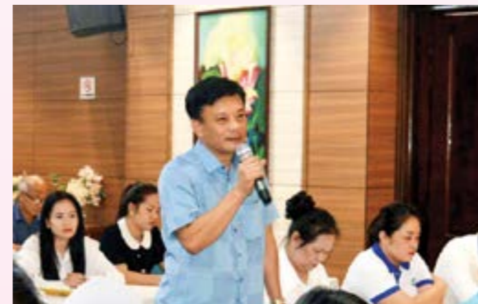
Các doanh nghiệp, HTX trao đổi thảo luận

Mục tiêu sàn thương mại điện tử (TMĐT) Buudien.vn trong năm 2024 sẽ đưa 100% các sản phẩm nông nghiệp và các sản phẩm OCOP từ 3 sao trở lên trên toàn quốc lên sàn TMĐT, đồng thời đưa tối thiểu 5.000 sản phẩm nông, lâm, thủy sản Việt đạt tiêu