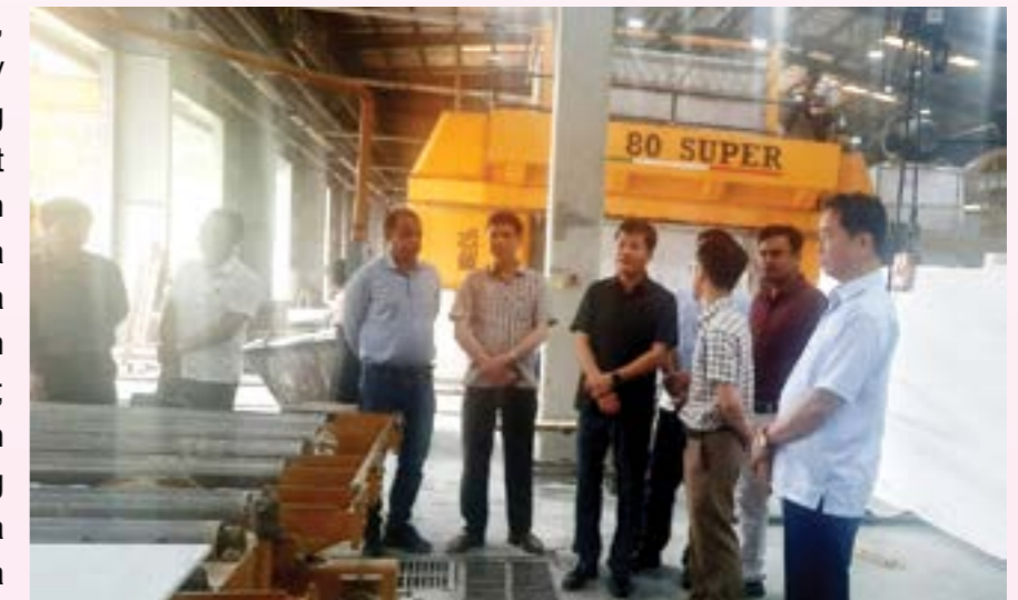
Phó Chủ tịch UBND tỉnh Ngô Hạnh Phúc kiểm tra thực tế, nắm bắt những khó khăn trong hoạt động sản xuất tại Công ty TNHH Đá cẩm thạch R.K Việt Nam

xuất, kinh doanh như: việc nộp tiền cấp quyền khai thác khoáng sản ảnh hưởng do khó khăn trong sản xuất, tiêu thụ sản phẩm; chất lượng và trữ lượng khoáng sản thực tế khác xa so với trữ lượng địa chất đã được phê duyệt; khó khăn do không bố trí được bãi đổ thải đúng thiết kế tiềm ẩn nhiều nguy cơ mất an toàn;