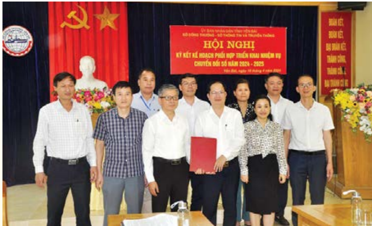
Lãnh đạo và cán bộ Sở Công thương - Sở Thông tin và Truyền thông chụp ảnh lưu niệm sau lễ ký kết phối hợp

ngày 31/12/2025. Kết thúc thời gian này, hai bên sẽ tổ chức Hội nghị tổng kết đánh giá kết quả thực hiện công tác phối hợp, thống nhất việc kết thúc các hoạt động phối hợp hoặc tiếp