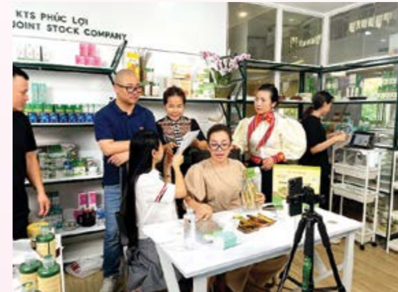
Phiên livestream của cơ sở kinh doanh thịt sấy Yên Phương

dựng video quảng bá thương hiệu sản phẩm trên TikTok; Hướng dẫn chuyên sâu về các kỹ năng bán hàng trên TikTok.