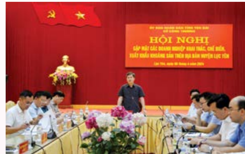
Đồng chí Ngô Hạnh Phúc - Phó Chủ tịch UBND tỉnh phát biểu tại Hội nghị

với tổng diện tích được cấp phép 650,93ha; tổng công suất khai thác các loại khoáng sản 2.850.107 m 3 /năm và 11.183.727 tấn/năm. Trong số 38 mỏ được cấp phép khai thác có 28