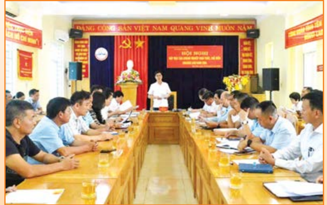
Sở Công Thương tỉnh Yên Bái tổ chức gặp mặt các doanh nghiệp khai thác, chế biến khoáng sản sắt, đồng, chì kẽm, graphit, than trên địa bàn tỉnh, bàn các giải pháp nhằm tháo gỡ khó khăn tạo điều kiện thuận lợi sản xuất kinh doanh.