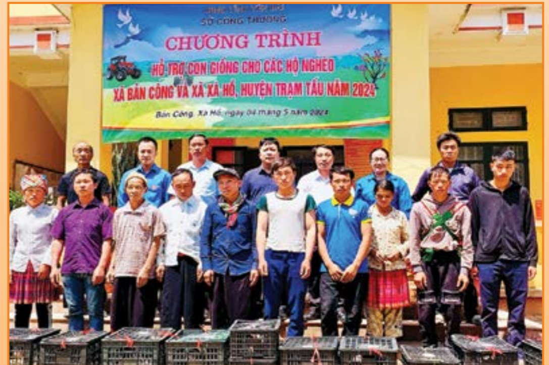
Sở Công Thương tỉnh Yên Bái hỗ trợ con giống cho các hộ nghèo xã Bản Công và xã Xà Hồ, huyện Trạm Tấu năm 2024