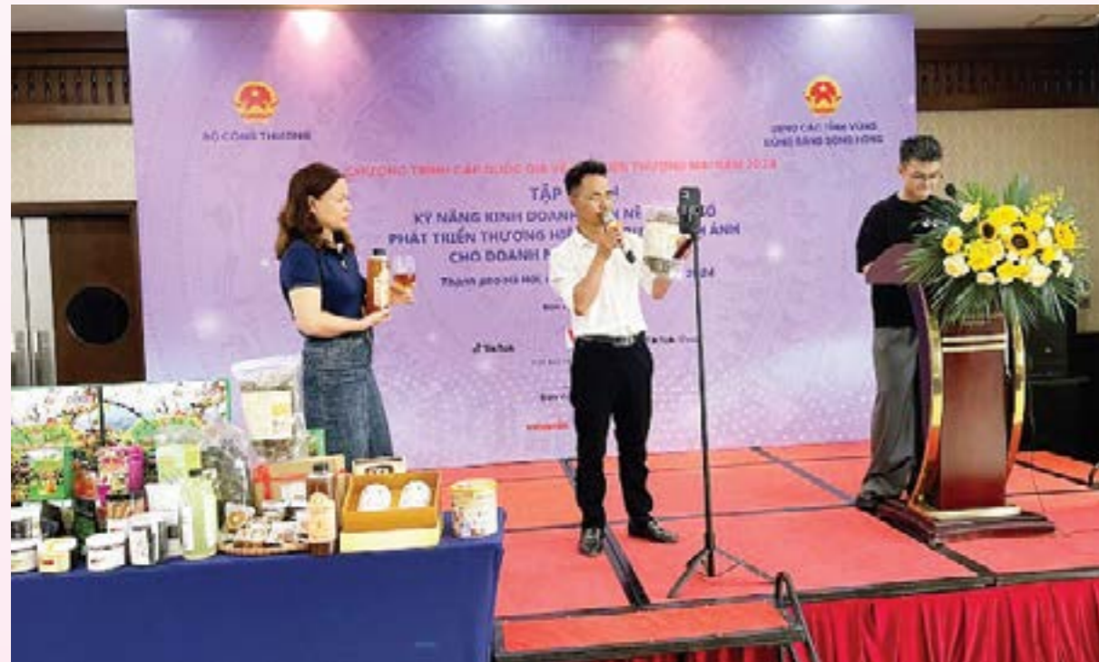
Các doanh nghiệp, HTX được hướng dẫn chuyên sâu về các kỹ năng bán hàng trên TikTok

Tại đây, các doanh nghiệp, HTX được nghe các chuyên gia phân tích sản phẩm tiềm năng của từng địa phương và nhu cầu thị trường; hướng dẫn cách lập kế hoạch tổ chức một hoạt động trình chiếu sản phẩm trên môi trường số; đào tạo kỹ năng và hướng dẫn trực tiếp về cách thức bán hàng trực tuyến (livestream), xây dựng các gian hàng trên sàn thương mại