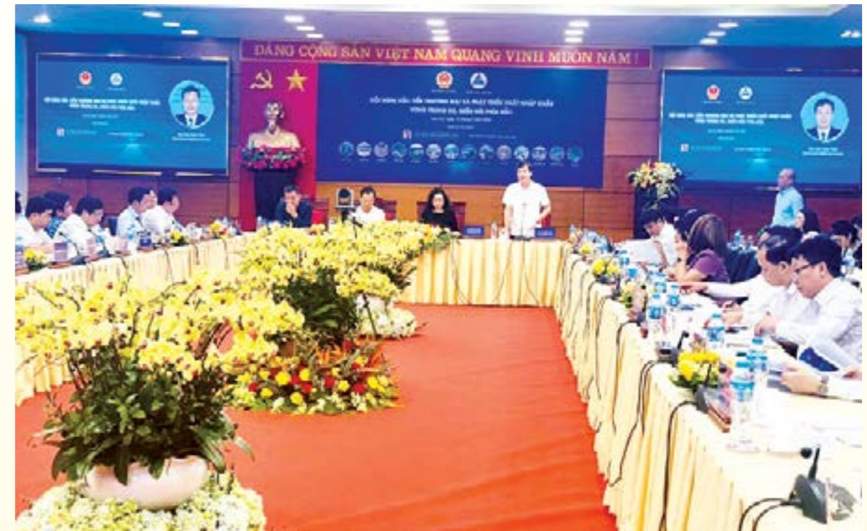
Đồng chí Ngô Hạnh Phúc - Phó Chủ tịch UBND tỉnh phát biểu tại hội nghị

Về phía tỉnh Yên Bái, dự hội nghị có đồng chí Ngô Hạnh Phúc - Phó Chủ tịch UBND tỉnh cùng lãnh đạo các sở, ngành liên quan.