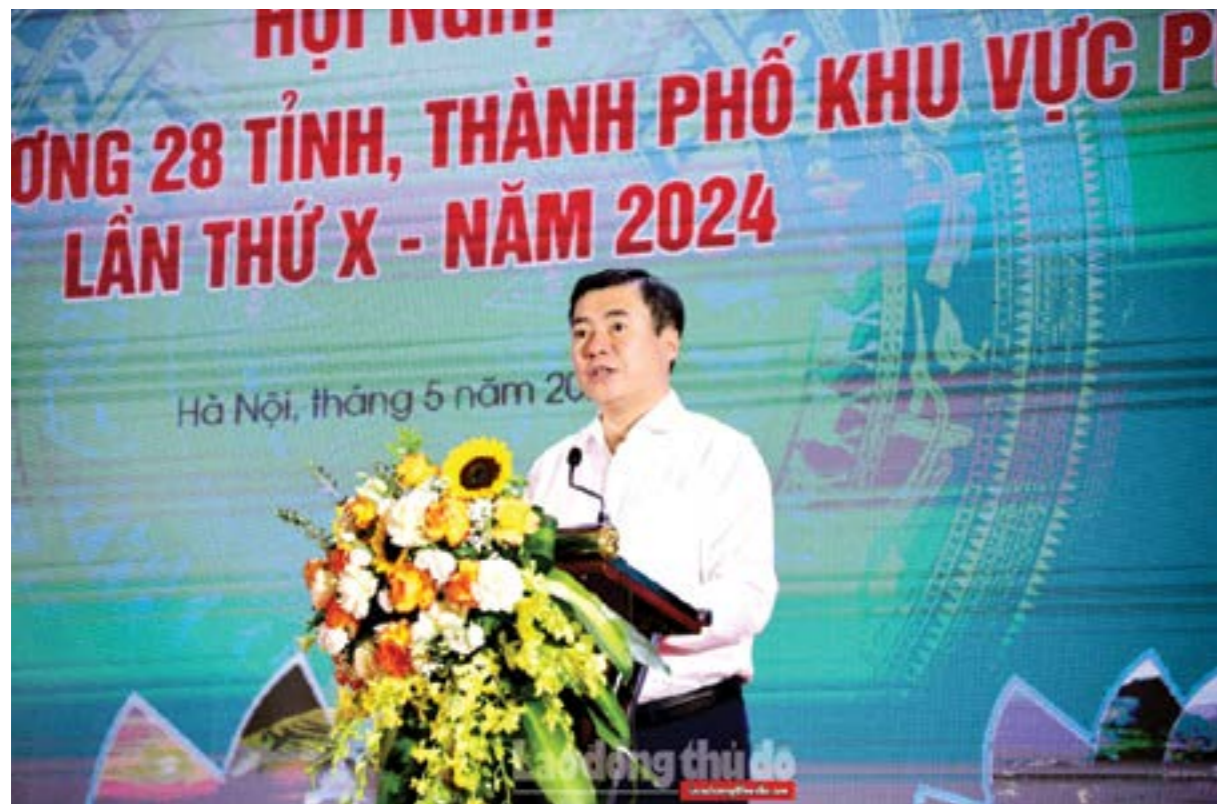
Thứ trưởng Bộ Công Thương Nguyễn Sinh Nhật Tân phát biểu tại Hội nghị.

Tuy nhiên, để đạt được mục tiêu kế hoạch năm 2024, góp phần quan trọng vào việc thực hiện hoàn thành kế hoạch 5 năm 2021-2025 và thực hiện thắng lợi các mục tiêu chung của toàn ngành Công Thương, Thứ trưởng Nguyễn Sinh Nhật Tân cũng đề nghị các địa phương tiếp tục phát động và tổ chức các phong trào thi đua trong các doanh nghiệp, phấn đấu đạt được các mục tiêu về sản xuất, kinh doanh.