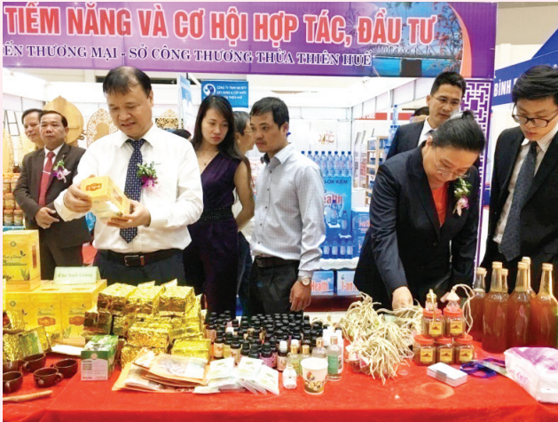
Lãnh đạo Cục Xúc tiến thương mại đến tham quan gian hàng của tỉnh Yên Bái