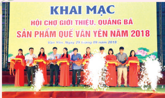
Các đồng chí lãnh đạo Sở Công thương, huyện Văn Yên cắt băng khai mạc hội chợ.

thực để các doanh nghiệp trong tỉnh và các doanh nghiệp trên địa bàn huyện Văn Yên có dịp mở rộng giao lưu kinh tế với các doanh nghiệp trong và ngoài nước, hợp tác đầu tư, phát triển sản xuất kinh doanh.