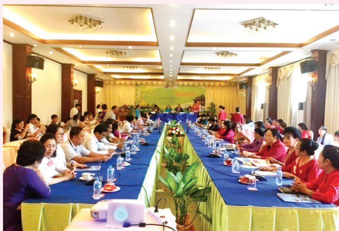
Hội nghị giao thương kết nối cung cầu giữa doanh nghiệp Viêng Chăn và doanh nghiệp Lào

Kết thúc chuyến công tác tại CHDCND Lào, các doanh nghiệp tham gia cùng đoàn đã ký kết được 02 biên bản ghi nhớ: Công ty cổ phần kỹ thuật Hoàng Liên Sơn và Công ty S.E.S Construction Complex Co.,LTD (ký kết được biên bản ghi nhớ tiêu thụ sản phẩm sứ cách điện); Công ty TNHH trà thảo mộc