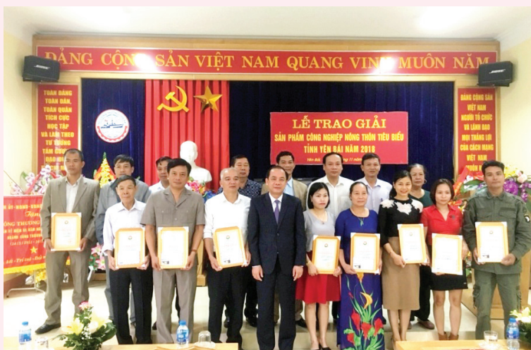
Trao giải sản phẩm công nghiệp nông thôn tiêu biểu tỉnh Yên Bái năm 2018

hỗ trợ kinh phí khuyến công địa phương và quốc gia; tham gia các hội nghị kết nối cung cầu hàng hoá giữa cơ sở sản xuất với các nhà phân phối trên cả nước để tìm kiếm hợp đồng, ký kết thoả thuận hợp tác kinh doanh.