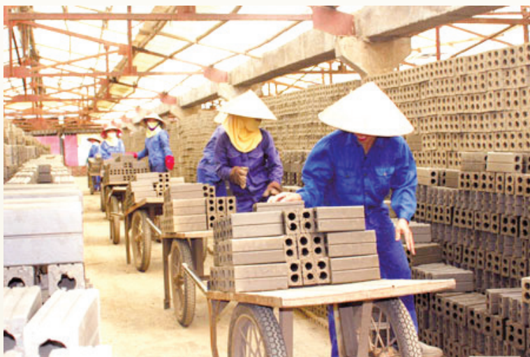
Sản xuất gạch không nung trên địa bàn tỉnh

Với chức năng của mình, ngành Công Thương