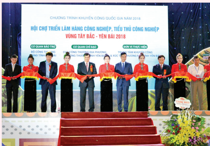
Các đồng chí lãnh đạo Sở Công thương, huyện Văn Yên cắt băng khai mạc hội chợ.