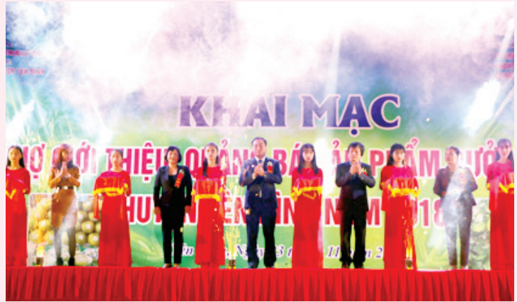
Lãnh đạo Sở Công thương tỉnh Yên Bái và huyện Yên Bình cắt băng khai mạc Hội chợ.

Hội chợ sẽ được tổ chức trong thời gian 7 ngày, từ ngày 23 đến ngày 29/11.