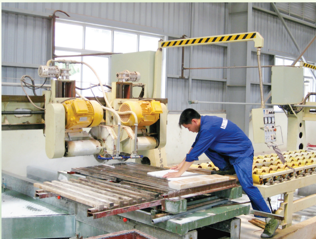
Sản xuất đá tấm tại Công ty TNHH đá cẩm thạch R.K Việt Nam

Sở Công Thương cũng đã nỗ lực triển khai nhiều giải pháp để duy trì cũng như đẩy mạnh giá trị xuất khẩu hàng hóa của địa phương. Trong đó, tập trung đẩy mạnh xúc tiến thương mại và thương mại điện tử để hỗ trợ các doanh nghiệp