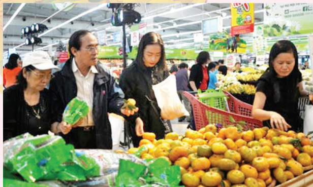
Người dân mua sắm các sản phẩm của tỉnh Yên Bái tại siêu thị Big C Thăng Long - Hà Nội.