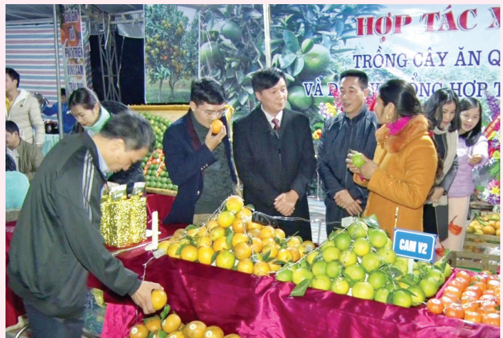
Các đồng chí lãnh đạo tham quan gian hàng sản phẩm cam Văn Chấn

Hội chợ không chỉ nhằm mục đích kích cầu tiêu dùng, xúc tiến quảng bá các sản phẩm nông sản thể mạnh của huyện Văn Chấn mà còn