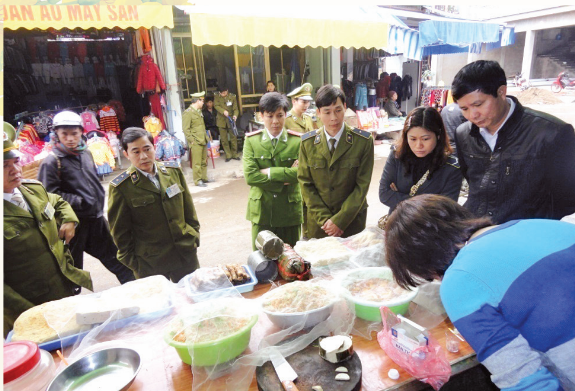
Đoàn thanh tra, kiểm tra liên ngành kiểm tra công tác an toàn thực phẩm

Sở Y tế chủ trì phối hợp với Sở Nông nghiệp và Phát triển nông thôn, Sở Công Thương và các đơn vị có liên quan tiến hành thanh tra, kiểm tra toàn diện việc chấp hành các quy định pháp luật về An toàn thực phẩm; tập trung vào các nhóm sản phẩm tiêu dùng nhiều trong dịp tết và mùa lễ hội xuân như bánh, kẹo, mứt, sữa chế biến, thịt cá, rau củ quả, rượu bia, nước giải khát,... và chú trọng đối tượng kiểm tra là các cơ sở có dấu hiệu vi phạm về đảm bảo chất lượng an toàn thực phẩm. Các cơ quan chức năng liên quan từ cấp tỉnh đến cấp huyện phối hợp chặt chẽ trong quá trình thanh tra, kiểm tra, nhằm nâng cao hiệu lực quản lý nhà nước, tránh chồng chéo và không bỏ sót cơ sở thực phẩm cần thanh tra. Kết hợp làm tốt công tác tuyên truyền, giáo dục kiến thức các quy định