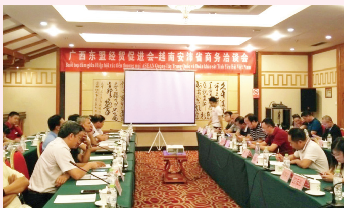
Hội thảo, kết nối giao thương với Hiệp hội xúc tiến kinh tế và thương mại Asean - Quảng Tây

Qua chuyến công tác tại Trung Quốc, các cán