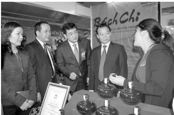
... và sản phẩm rượu Bách Chi của thị xã Nghĩa Lộ tại Hội chợ.

Hội chợ với quy mô trên 300 gian hàng của hơn 150 doanh nghiệp và các tổ chức trong và ngoài tỉnh tham gia trưng bày, triển lãm, giới thiệu các mặt hàng đa dạng, phong phú, chất lượng với các sản phẩm công nghiệp tiêu biểu của tỉnh; các mặt hàng nông - lâm - thủy sản, lương