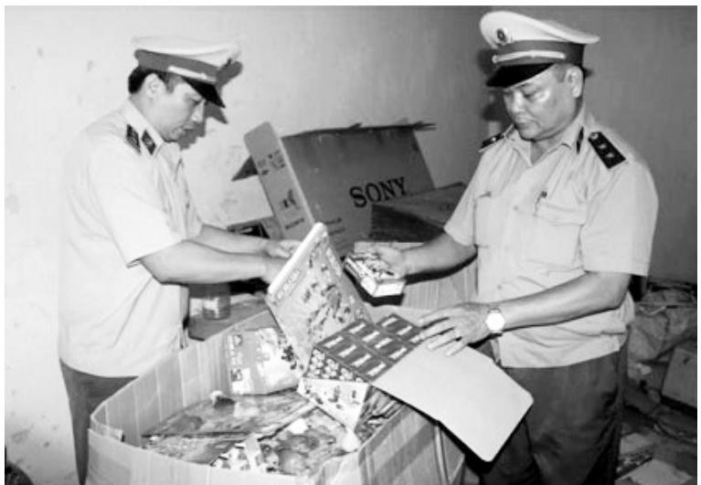
Đội Quản lý thị trường số 1 kiểm tra thu giữ đồ chơi trẻ em không rõ nguồn gốc.

Theo số liệu của Tổng cục Thống kê, chỉ số giá tiêu dùng (CPI) tháng 10/2017 tăng 0,41% so với tháng 9, tăng 2,98% so với cùng kỳ. CPI bình quân 10 tháng đầu năm tăng 3,715 so với cùng kỳ năm trước. Nhóm hàng hóa dịch