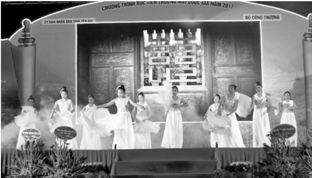
Tiết mục văn nghệ tại Lễ khai mạc Hội chợ Công thương khu vực Tây Bắc - Yên Bái năm 2017.

trình xúc tiến thương mại quốc gia và cũng là một trong những nội dung tỉnh Yên Bái thực hiện để kết nối cung cầu, phát triển giao thương tiêu thụ sản phẩm trong năm 2017, Hội chợ Công thương khu vực Tây Bắc - Yên Bái năm 2017 là điều kiện tốt để các tổ chức kinh tế, các