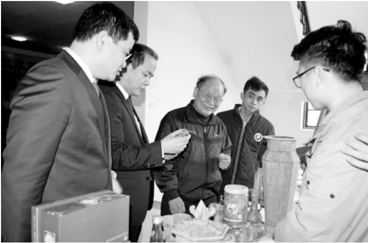
Lãnh đạo tỉnh Yên Bái và Cục Xúc tiến thương mại, Bộ Công thương tham quan gian hàng trưng bày sản phẩm quê Văn Yên.