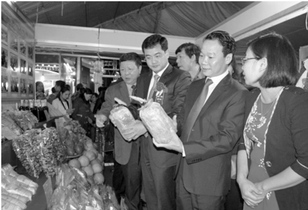
Các đồng chí lãnh đạo tỉnh và Cục Xúc tiến thương mại, Bộ Công thương tham quan các gian hàng nông sản...

doanh nghiệp gặp gỡ, trao đổi kinh nghiệm trong hoạt động sản xuất kinh doanh, liên kết đầu tư, mở rộng thị trường, mua - bán hàng hóa, quảng bá thương hiệu, hình ảnh và sản phẩm trên thị trường Yên Bái và các tỉnh khu vực Tây Bắc cũng như thị trường trong và ngoài nước.