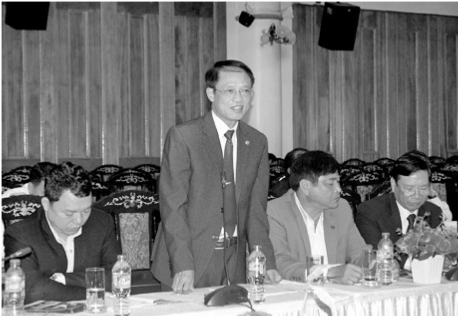
Đại biểu tỉnh Lạng Sơn tham gia thảo luận tại Hội nghị.

xuất kinh doanh của các doanh nghiệp trong và ngoài tỉnh.