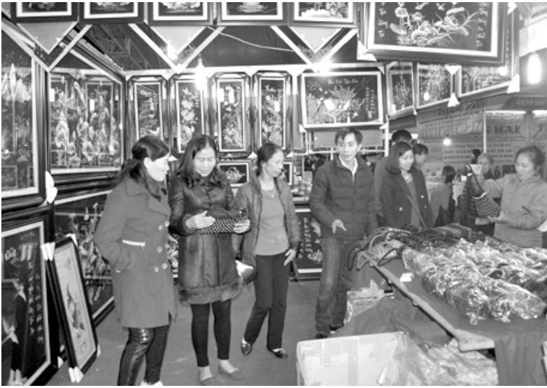
Đông đảo nhân dân đến tham quan các gian hàng tại hội chợ.