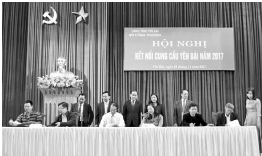
Tại Hội nghị, đã có 6 hợp đồng và 9 biên bản ghi nhớ được ký kết giữa các doanh nghiệp tỉnh Yên Bái với các tỉnh bạn.

Thời gian qua, Yên Bái đã thu hút nhiều tập