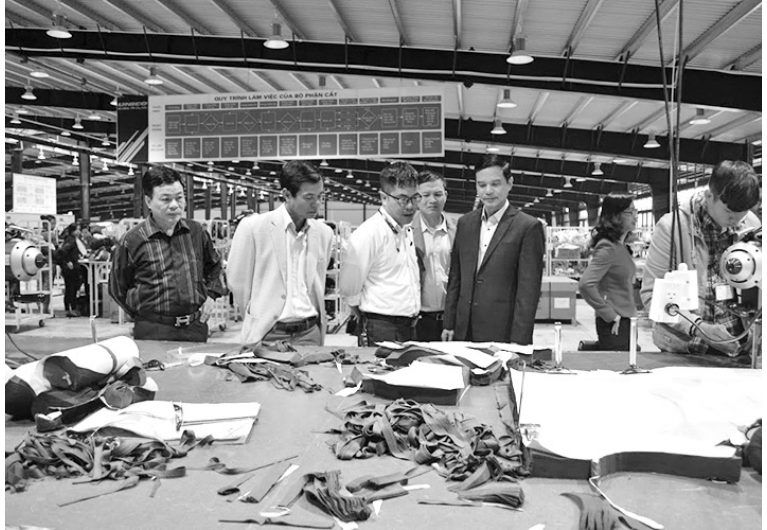
Nhà đầu tư thăm quan Công ty TNHH Unico Global Yên Bái tại khu công nghiệp Âu Lâu.

Với những giải pháp kể trên, thời gian qua,