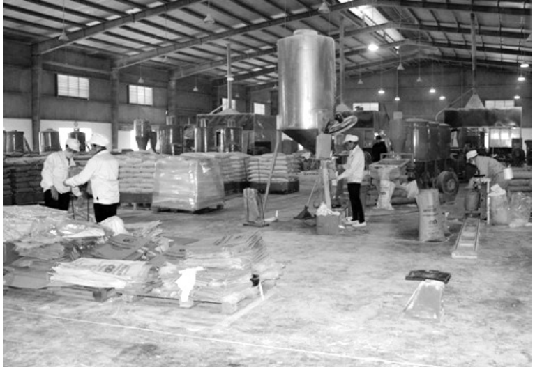
Quang cảnh sản xuất tại Công ty Cổ phần Nhựa và Khoáng sản An phát

Mục tiêu đề ra là trong giai đoạn 2016 - 2020, tỉnh Yên Bái phấn đấu tốc độ tăng trưởng GRDP của ngành thương mại (theo giá hiện hành) bình quân đạt 12,66%/năm. GRDP ngành thương mại đến năm 2020 đạt 2.900 tỷ đồng và phấn đấu đến năm 2030 GRDP ngành