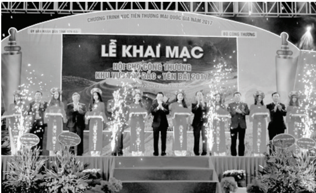
Các đồng chí lãnh đạo cắt băng khai mạc Hội chợ Công thương khu vực Tây Bắc - Yên Bái năm 2017.

trình xúc tiến thương mại quốc gia và cũng là một trong những nội dung tỉnh Yên Bái thực hiện để kết nối cung cầu, phát triển giao thương tiêu thụ sản phẩm trong năm 2017, Hội chợ Công thương khu vực Tây Bắc - Yên Bái năm 2017 là điều kiện tốt để các tổ chức kinh tế, các