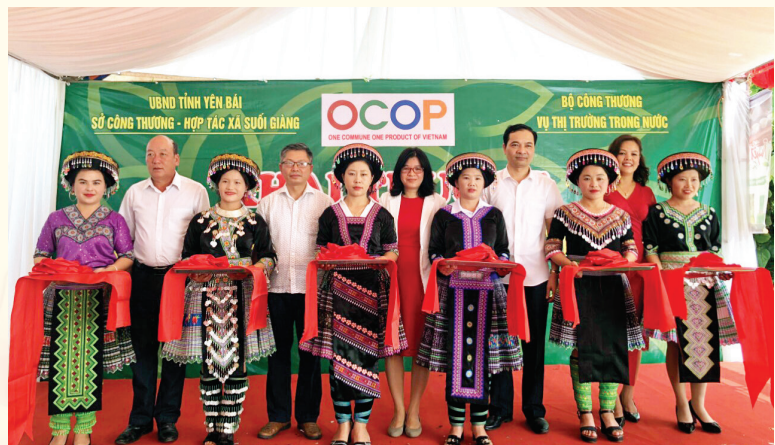
Các lãnh đạo cắt băng khai trương gian hàng OCOP tại xã Suối Giàng, huyện Văn Chấn, tỉnh Yên Bái

Tại địa điểm khai trương có trên 40 sản phẩm nông sản, thực phẩm, đồ uống đạt quy chuẩn an toàn và mang tính đặc hữu vùng miền của Yên Bái do