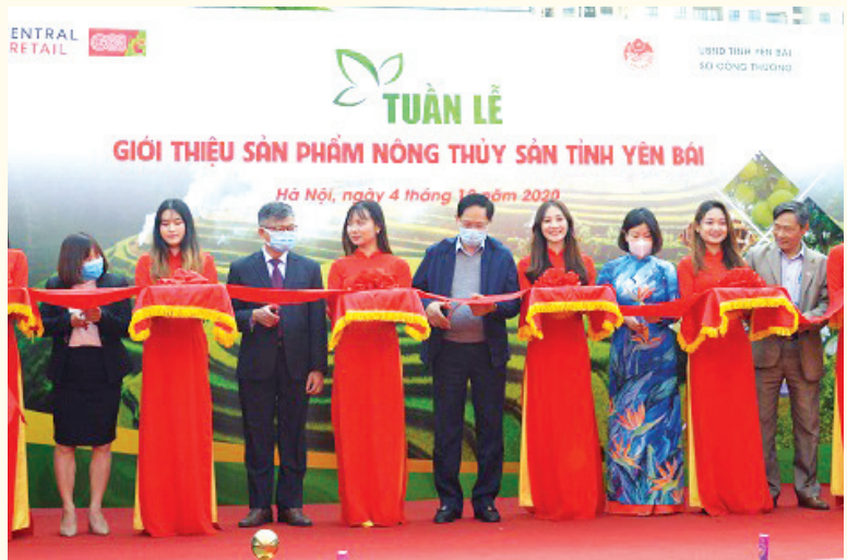
Khai mạc Tuần lễ giới thiệu sản phẩm nông, thủy sản tỉnh Yên Bái tại Siêu thị BigC Hà Nội

Mỗi chương trình có sự tham gia của 20 gian hàng đến từ các doanh nghiệp, hợp tác xã (HTX) tiêu biểu của tỉnh Yên Bái. Tại Lễ khai mạc tuần hàng, khách hàng sẽ có cơ hội trải nghiệm cũng như thoải mái mua sắm các loại đặc sản đã được cấp chứng nhận là sản phẩm đạt tiêu chuẩn vệ sinh an toàn thực phẩm, nổi tiếng của tỉnh Yên Bái như: bưởi Đại Minh, cá hồ Thác Bà, chè Suối Giàng, măng, thịt sấy, xôi nếp Tú Lệ, gạo