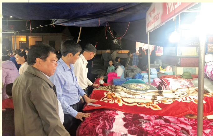
Lãnh đạo Trung tâm Khuyến công và XTTM, huyện Lục Yên tham quan gian hàng

Mỗi phiên chợ năm nay được tổ chức đã thu hút được trên 30 gian hàng của 20 doanh nghiệp trong và ngoài tỉnh tham gia với các mặt hàng tiêu dùng chủ yếu như: Quần áo, giày dép, đồ gia dụng... Thông qua các phiên chợ đưa hàng Việt về nông thôn các doanh nghiệp có cơ hội thuận lợi để quảng bá thương hiệu, mở rộng kênh phân phối, tăng thị phần, phát triển thị trường nội địa.