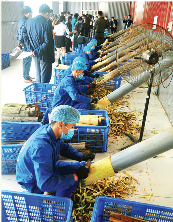
Người lao động HTX Quế Hồi Việt Nam chế biến quế vỏ

được tổ chức Control Union của châu Âu cấp chứng nhận Organic (hữu cơ) theo tiêu chuẩn châu Âu và Nhật Bản cho 500/700 ha quế tại xã Đào Thịnh.