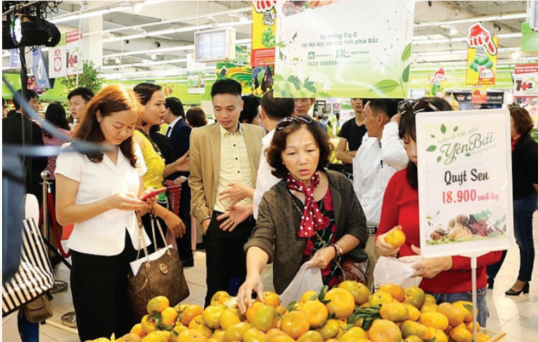
Yên Bái đẩy mạnh giới thiệu sản phẩm địa phương tới các siêu thị tại Hà Nội

về tổng mức bán lẻ hàng hóa và doanh thu dịch vụ tiêu dùng toàn tỉnh đạt 30.000 tỷ đồng, giá trị sản xuất công nghiệp đạt 21.000 tỷ đồng trở lên.