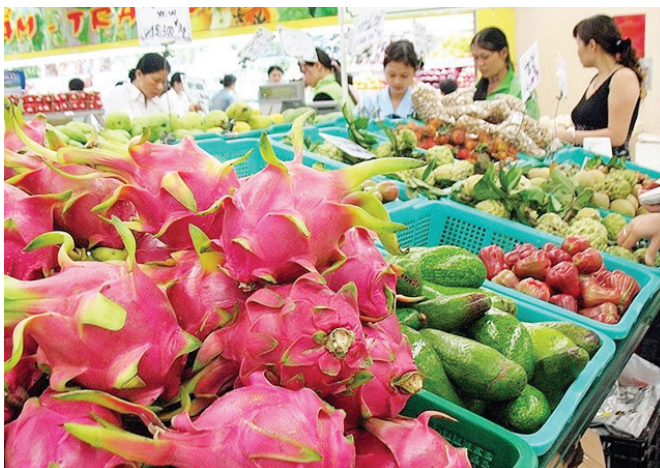
Duy trì tăng trưởng ổn định

Điểm tích cực thứ hai, dù không phải mặt hàng nào trong nhóm hàng nông nghiệp cũng tăng XK, nhưng giá duy trì tốt. Giá XK bình quân cà phê đạt 1.963 USD/tấn trong tháng 11/2020, tăng 5,7% so với tháng 10/2020 và tăng 12,2% so với cùng kỳ năm 2019; giá XK hạt tiêu tăng 3,6% so với tháng 10/2020 và tăng 8,1% so với cùng kỳ năm 2019; giá XK cao su tăng 8,8% so với tháng 10/2020 và tăng 15% so với cùng kỳ năm 2019... “Mức tăng này cho thấy thị trường quốc tế vẫn có nhu