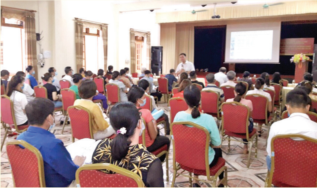
Quang cảnh lớp tập huấn

kinh doanh hiệu quả, đồng thời biết cách bảo quản các hàng hóa sản phẩm ... nhằm góp phần nâng cao năng lực phân phối và tiêu thụ sản phẩm mang thương hiệu Việt, xây