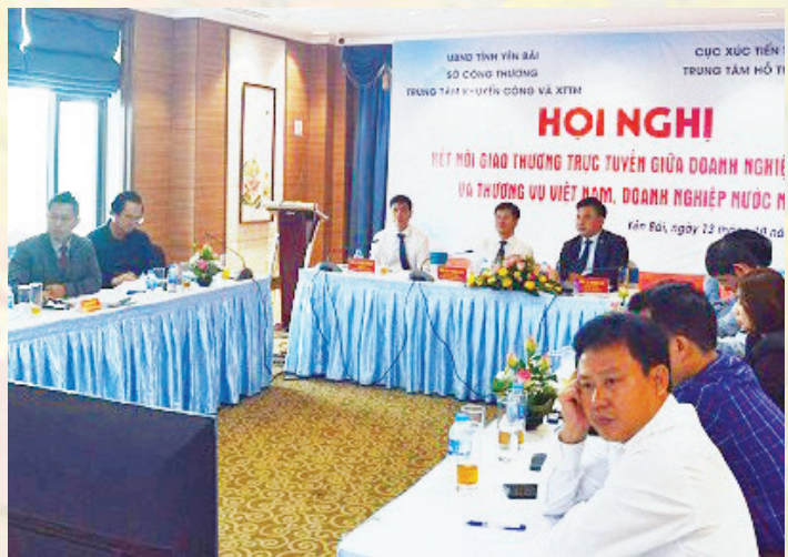
Quang cảnh Hội nghị tại điểm cầu tỉnh Yên Bái.