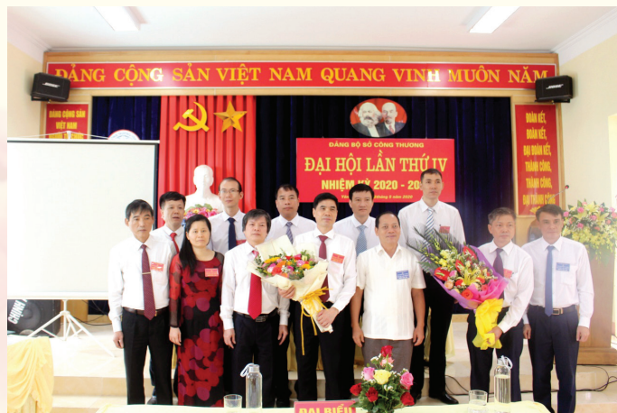
Ban Chấp hành Đảng bộ Sở Công Thương khóa IV, nhiệm kỳ 2020-2025

Trong nhiệm kỳ 2015 - 2020, Đảng bộ Sở Công Thương luôn nhận được sự quan tâm, chỉ đạo của Tỉnh ủy, Ban Cán sự Đảng UBND tỉnh, Đảng ủy Khối các cơ quan và doanh nghiệp tỉnh, sự phối hợp chặt chẽ của các sở, ngành, địa phương; tập thể Đảng bộ luôn đoàn kết, thống nhất thực hiện tốt công tác xây dựng Đảng, lãnh đạo các phòng chuyên môn, đơn vị trực thuộc hoàn thành xuất sắc