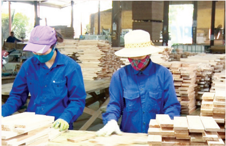
Sản xuất gỗ trên địa bàn tỉnh

Công tác XTTM được đổi mới, đã thực hiện có hiệu quả các đề án, chương trình XTTM như: Đẩy mạnh công tác tuyên truyền trên môi trường trực tuyến; Xây dựng thành công 02 điểm giới thiệu và bán sản phẩm OCOP trên địa bàn tỉnh Yên Bái; Tổ chức 05 phiên chợ đưa hàng Việt về miền núi tại các huyện: Lục Yên, Văn Yên, Mù Cang Chải, Trạm Tấu, Văn Chấn, tổ chức 15 hội chợ triển lãm thương mại trên địa bàn tỉnh; Tổ chức thành công 02 tuần hàng giới thiệu sản phẩm nông sản của tỉnh Yên Bái