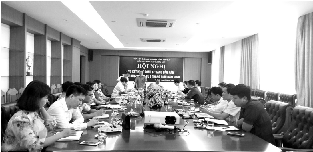
Toàn cảnh Hội nghị

N gày 15/7, Hiệp hội Doanh nghiệp tỉnh Yên Bái tổ chức Hội nghị sơ kết 6 tháng đầu năm và thảo luận về các giải pháp tháo gỡ khó khăn, vướng mắc cho doanh nghiệp khối thương mại và dịch vụ 6 tháng cuối năm 2020.