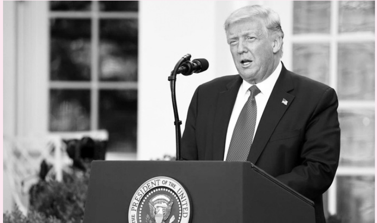
Tổng thống Mỹ Donald Trump ngày 14/7 phát biểu tại Vườn Hồng, Nhà Trắng

Tổng thống Trump cuối tháng 5 chỉ đạo chính quyền bắt đầu quá trình loại bỏ chính