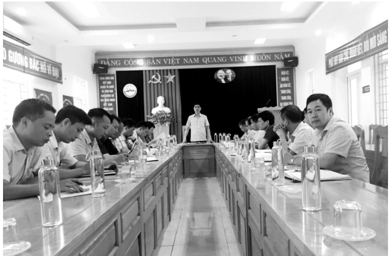
Quang cảnh Hội nghị sơ kết 6 tháng đầu năm 2020

Đã triển khai thực hiện tốt công tác cải cách hành chính nhất là tham gia giải quyết TTHC tại Trung tâm phục vụ hành chính công của tỉnh. Đã tham mưu cho UBND tỉnh ban hành quyết định về quy trình nội bộ giải quyết TTHC của sở; thường xuyên rà soát, cập nhật các TTHC mới đi đôi với nâng cao năng lực