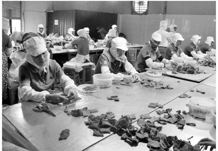
Năm 2020, phân đấu hỗ trợ cho các doanh nghiệp nhỏ và vừa trên địa bàn tỉnh với kinh phí hỗ trợ từ 13 tỷ đồng trở lên

Theo kế hoạch, tỉnh sẽ hỗ trợ mặt bằng sản xuất cho 8 doanh nghiệp trở lên với tổng kinh phí trên 1.800 triệu đồng; hỗ trợ đổi mới công nghệ cho trên 17 doanh nghiệp với tổng kinh phí trên 1.700 triệu đồng; hỗ trợ phát triển nguồn nhân lực cho hàng trăm doanh nghiệp với tổng kinh phí hỗ trợ trên 500 triệu đồng; hỗ trợ mở rộng thị trường cho trên 33 doanh nghiệp với tổng kinh phí trên 600 triệu đồng; hỗ trợ doanh nghiệp nhỏ và vừa chuyển đổi từ hộ kinh doanh trên 116 doanh nghiệp với tổng kinh phí hỗ trợ trên 4.600 triệu đồng; hỗ trợ doanh nghiệp nhỏ và vừa khởi nghiệp sáng tạo với tổng kinh phí trên 1.800 triệu đồng; hỗ