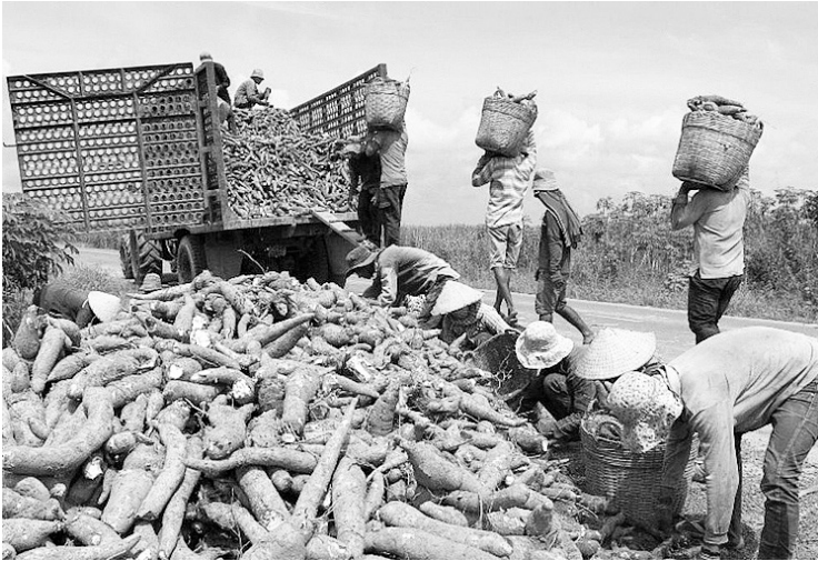
Xuất khẩu sắn và các sản phẩm sắn sang thị trường Trung Quốc giảm tốc

Các chuyên gia dự báo, xuất khẩu sắn lát và tinh bột sắn của Việt Nam sẽ tốt hơn trong thời