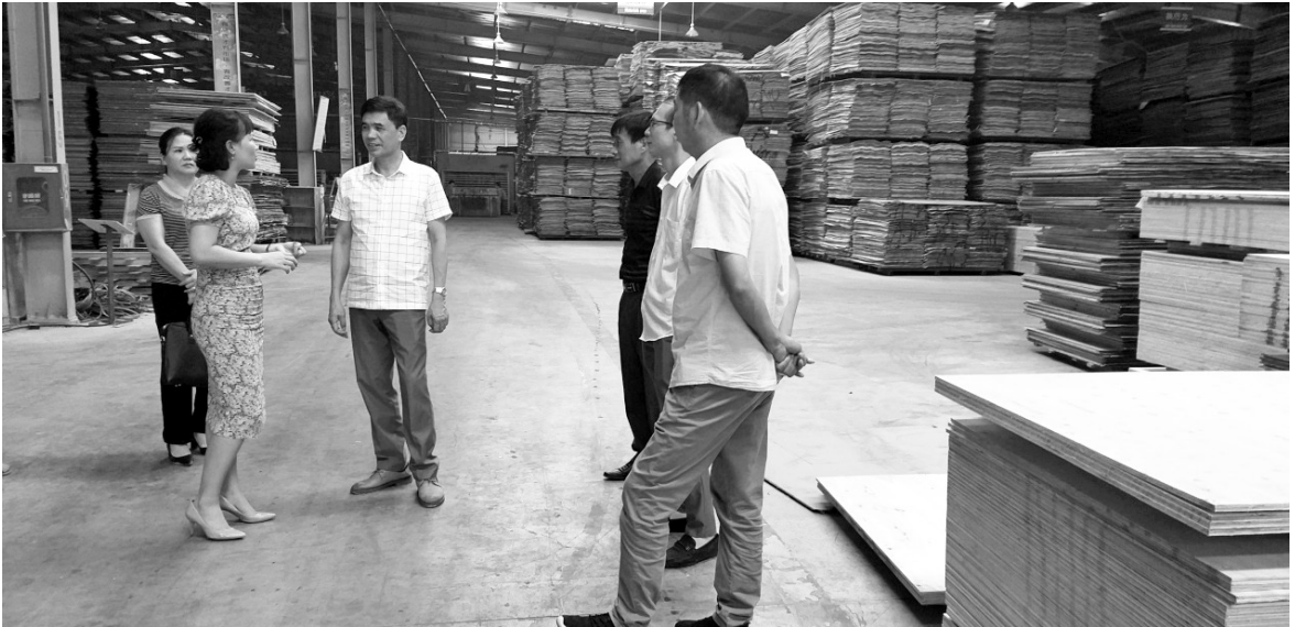
Lãnh đạo Sở Công Thương, Ban Quản lý khu công nghiệp đến làm việc với Công ty TNHH ngành Gỗ Thiên An Việt Nam

không ít khó khăn như: nguồn vốn phân bổ để đầu tư hạ tầng cho các khu công nghiệp hạn chế, nên các công trình hạ tầng tại các khu công nghiệp chưa được đầu tư hoàn thiện, đồng bộ, gây khó khăn trong công tác mời gọi, thu hút các nhà đầu tư vào trong khu công nghiệp, cũng như khó khăn trong quá trình sản xuất kinh doanh của các doanh nghiệp; Các công trình hạ tầng trong các khu công nghiệp chưa được đầu tư đồng bộ: hệ thống đường nội bộ chủ yếu mới mở nền, cấp phối, chưa có hệ thống thoát nước mặt, hệ thống xử lý nước thải tập trung, mùa mưa đến đất đá trôi từ những khu vực đang san tạo mặt bằng xuống làm ảnh hưởng đến kết cấu hạ tầng khu công nghiệp và diện tích đất canh tác, sản xuất kinh doanh của những hộ gia đình xung quanh khu công nghiệp, dẫn đến thường xuyên phải giải quyết đền bù, hỗ trợ thiệt hại vùng ảnh hưởng cho các hộ dân; Một số tuyến đường trong khu công nghiệp phía Nam đã được đầu tư và đang khai thác sử dụng, chưa có nguồn kinh phí bảo dưỡng thường xuyên nên đã xuống cấp, gây khó khăn cho việc giao thông đi lại