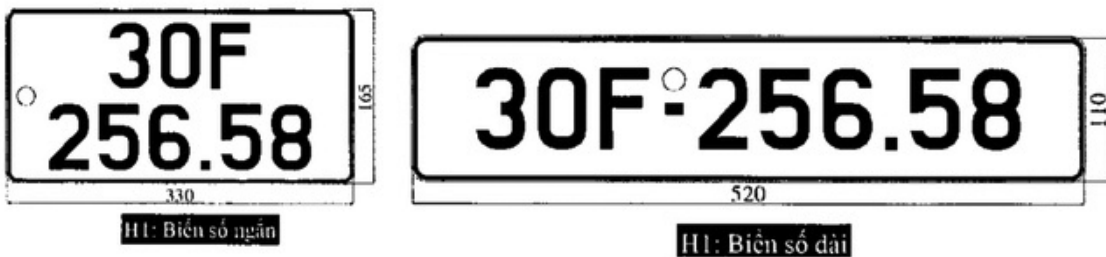
Kích thước mới của biển số ô tô trong nước.

“Việc này sẽ giúp cho cơ quan chức năng dễ dàng nhận ra xe kinh doanh vận tải trên đường. Từ đó, việc quản lý, hạn chế hoặc cấm các phương tiện này tại các tuyến đường đô thị được thực hiện tốt hơn”, đại diện Cục CSGT nói với Zing.