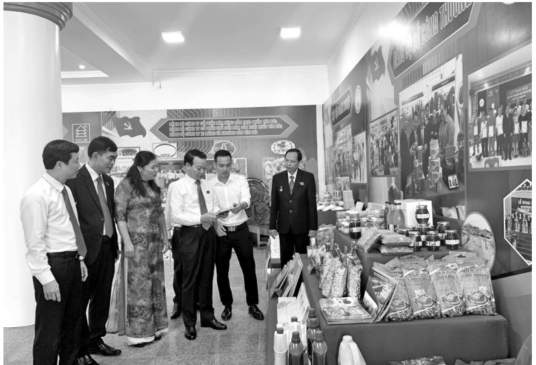
Đồng chí Đỗ Đức Duy, Phó Bí thư Tỉnh ủy, Chủ tịch UBND tỉnh và các đại biểu tham quan gian hàng triển lãm của Đảng bộ Sở Công Thương

Trong thời gian qua, dưới sự lãnh đạo, chỉ đạo Tỉnh ủy, Hội đồng nhân dân, Ủy ban nhân dân tỉnh và sự phối hợp của cả hệ thống chính trị, Đảng bộ Sở Công Thương đã chỉ đạo tổ chức thực hiện tốt công tác quản lý