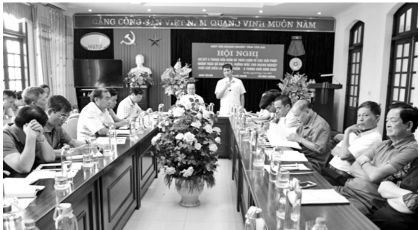
Toàn cảnh Hội nghị

Tuy nhiên các doanh nghiệp của hội luôn nỗ