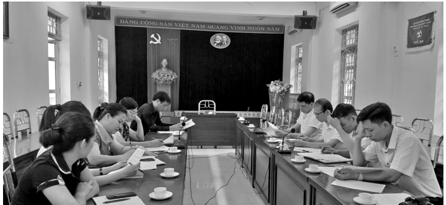
Lãnh đạo Sở Công Thương làm việc với Ban Quản lý khu công nghiệp tỉnh

Tính đến hết tháng 6/2020 đã có 53 nhà đầu tư đăng ký thực hiện với 55 dự án đầu tư trong các khu công nghiệp của tỉnh, với tổng vốn đầu tư đăng ký 11.810 tỷ đồng; tổng diện tích đất đăng ký sử dụng 326ha, trong đó: có 31 dự án đã đi vào hoạt động (tổng vốn đầu tư đăng ký 4.757 tỷ đồng, diện tích đất sử dụng 147,42ha); 04 dự án đang đầu tư xây dựng (tổng vốn đầu tư đăng ký 787 tỷ đồng, diện tích đất sử dụng