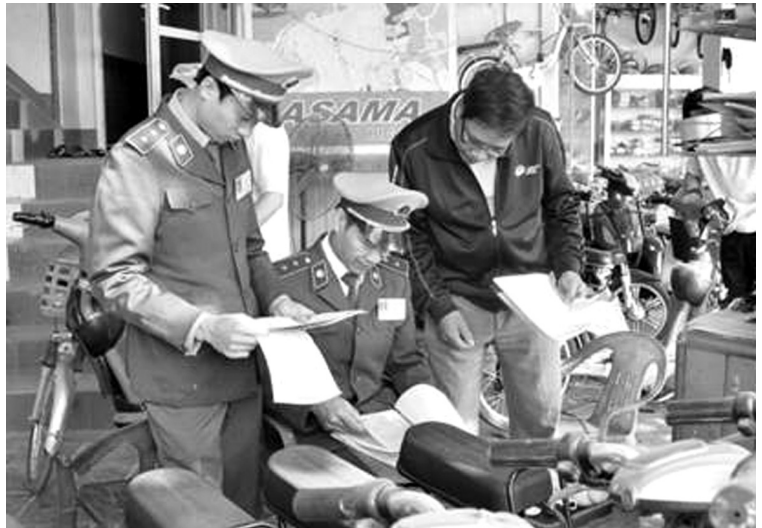
Lực lượng QLTT đang làm nhiệm vụ

Với đặc thù là Đội Quản lý thị trường (QLTT) địa bàn, với số lượng cán bộ công chức là 09 người cùng với nhiệm vụ được giao là thực hiện