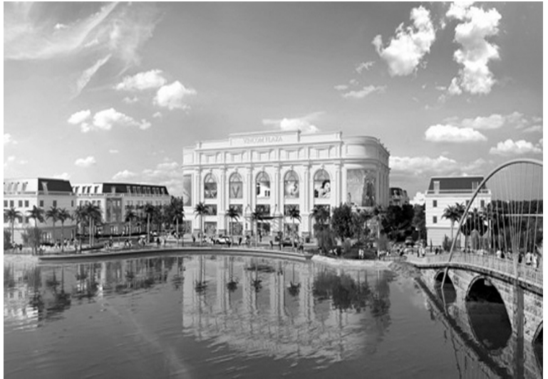
Tỉnh Yên Bái luôn tạo môi trường thông thoáng thu hút các doanh nghiệp, tập đoàn lớn thực hiện dự án đầu tư trung tâm thương mại, siêu thị, trung tâm Logistics.

Mục tiêu đề ra là trong giai đoạn 2016 - 2020, tỉnh Yên Bái phần đầu tốc độ tăng trưởng GRDP của ngành thương mại (theo giá hiện hành) bình quân đạt 12,66%/năm. GRDP ngành thương mại đến năm 2020 đạt 2.900 tỷ đồng và phần đầu đến đến năm 2030 GRDP ngành