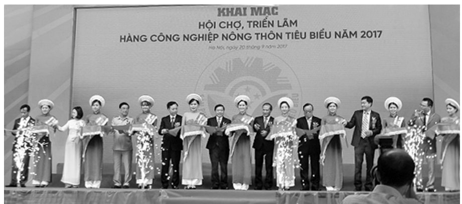
(Cắt băng khai mạc Hội chợ triển lãm hàng công nghiệp nông thôn tiêu biểu cấp quốc gia năm 2017)

Hội chợ nhằm tạo điều kiện cho các cơ sở sản xuất công nghiệp nông thôn tham gia, tập trung bày, quảng bá, giới thiệu sản phẩm, học hỏi