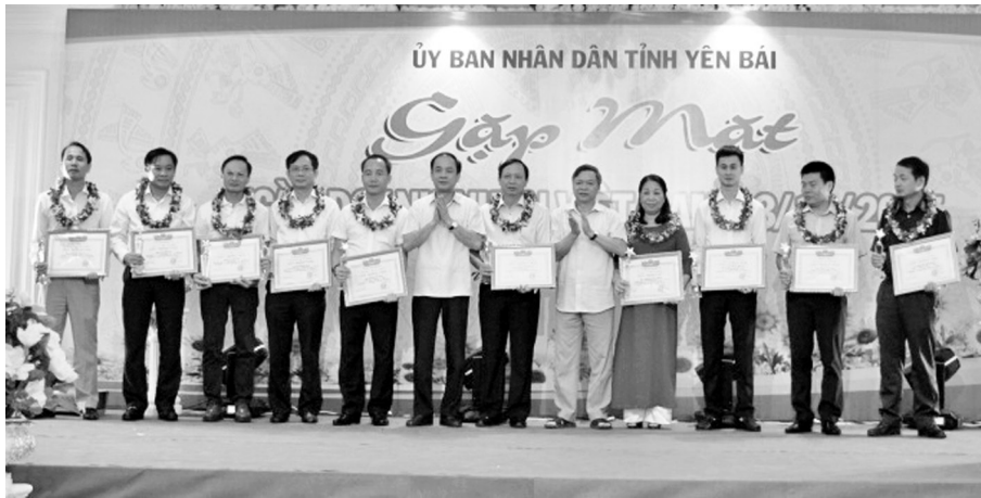
Đồng chí Đỗ Đức Duy - Phó Bí thư Tỉnh ủy, Chủ tịch UBND tỉnh tặng bằng khen và cúp lưu niệm cho các doanh nghiệp tiêu biểu

nghiệp đã giải quyết việc làm cho trên 31 nghìn lao động với mức thu nhập bình quân 4,5 triệu đồng/người/tháng.