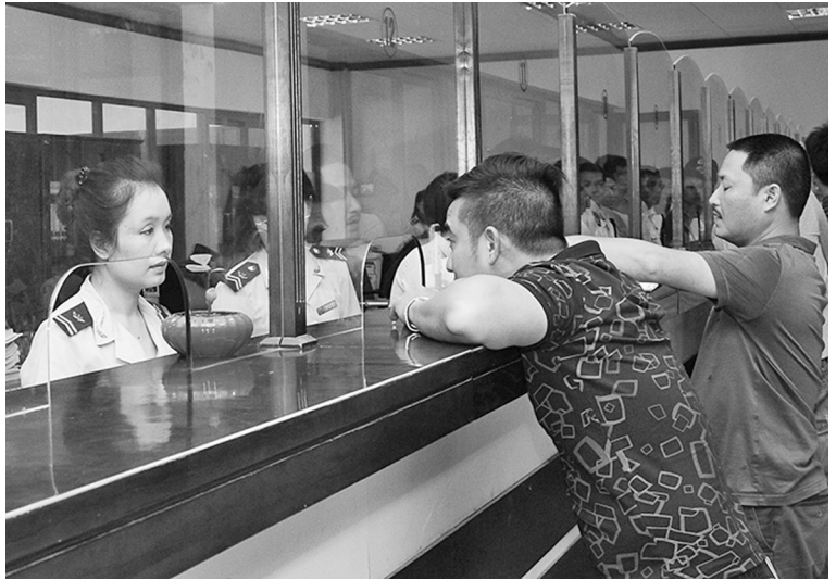
Ngành hải quan sẽ tăng cường phát triển quan hệ đối tác với cộng đồng doanh nghiệp

Hay, Cục HQ Bình Dương đã kiện toàn lại Tổ tư vấn trực tuyến để giải đáp các thắc mắc của DN, đồng thời, kiện toàn Tổ phát triển quan hệ đối tác theo thực tế công việc, kịp thời xử lý các vấn đề vướng mắc phát sinh. Từ đầu năm đến nay, Tổ tư vấn trực tuyến của HQ Bình Dương đã trả lời trên 140 câu hỏi của các DN thông