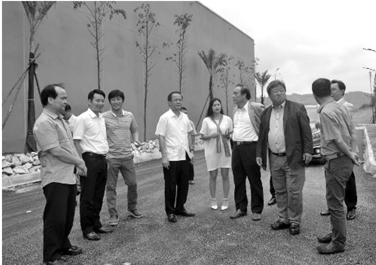
Các nhà đầu tư Hàn Quốc tìm hiểu, khảo sát khu công nghiệp Âu Lâu.

H iện nay, Yên Bái có 4 khu công nghiệp, với tổng diện tích 722 ha, trong đó có 3 khu công nghiệp quốc gia, 1 khu công nghiệp của tỉnh và 10 cụm công nghiệp, với tổng diện tích 398,78 ha. Đặc biệt các khu công nghiệp của tỉnh đều được quy hoạch bám sát đường cao tốc Nội Bài - Lào Cai, rất thuận lợi cho nhà đầu tư trong lưu thông hàng hóa.