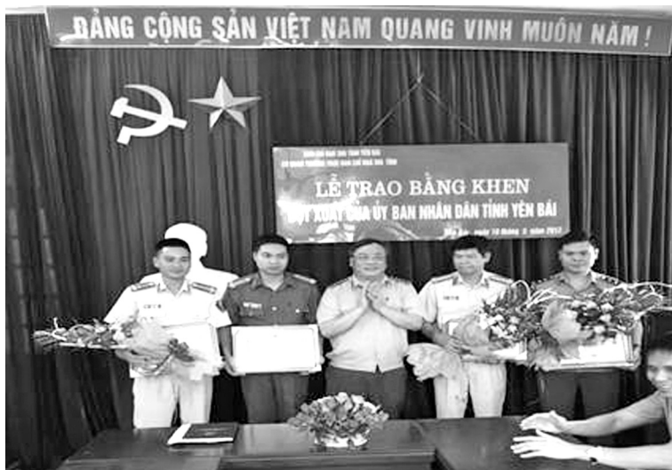
UBND tỉnh trao bằng khen cho các cá nhân có thành tích

Tuy nhiên, tình trạng buôn lậu, gian lận