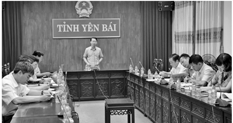
Đồng chí Đỗ Đức Duy - Phó Bí thư Tỉnh ủy, Chủ tịch UBND tỉnh phát biểu tại buổi làm việc.

Tại buổi làm việc, đại diện các ngành tham gia góp ý vào nội dung điều chỉnh Quy hoạch, tập trung chủ yếu vào việc đánh giá kết quả phát triển ngành thương mại, dịch vụ giai đoạn 2011 - 2015 làm cơ sở đưa ra mục tiêu phát triển trong những năm tiếp theo; về mục tiêu chung của Quy hoạch; về quy hoạch phát triển hệ thống kết cấu hạ tầng thương mại như: hệ