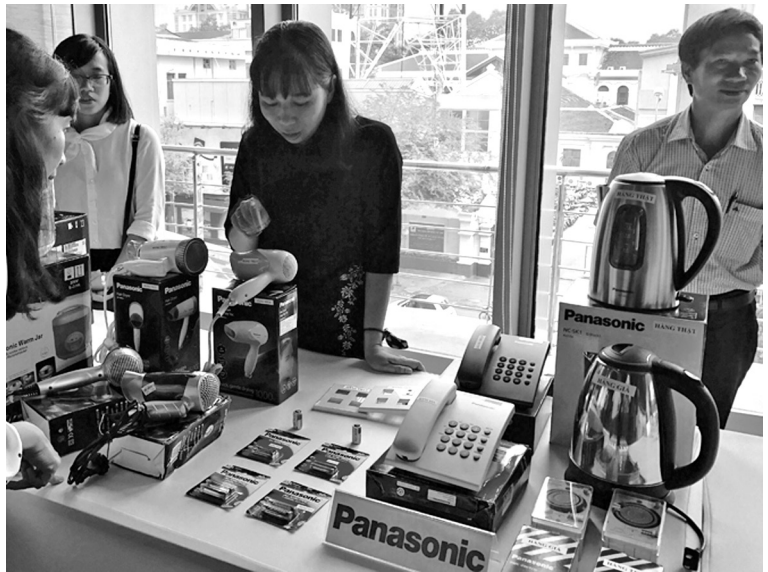
Hàng do doanh nghiệp Nhật Bản sản xuất bị làm giả