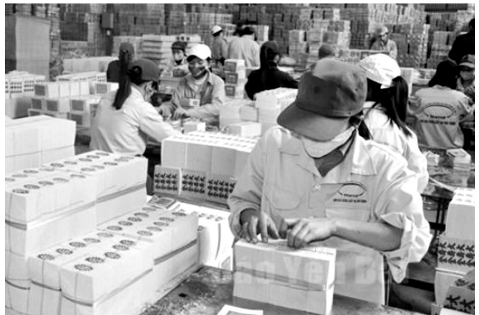
Sản xuất giấy vàng mã tại Yên Bái

Sản xuất giấy được coi là ngành kinh tế mũi nhọn ở Yên Bái, không chỉ góp phần tiêu thụ sản