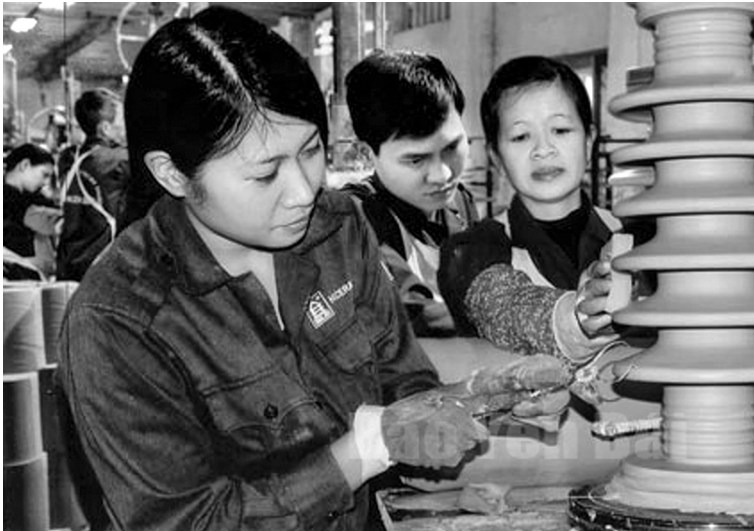
Công ty Cp Sứ kỹ thuật Hoàng Liên Sơn

B ước vào thực hiện nhiệm vụ kế hoạch năm 2017, mặc dù gặp nhiều khó khăn song hoạt động của ngành Công Thương đã có bước phục hồi, phát triển và thu được những kết quả khả quan. Nhờ công tác giao nhiệm vụ kế hoạch được thực hiện từ cuối năm 2016, các bước triển khai thực hiện kế hoạch được quan tâm chỉ đạo sớm nên tình hình sản xuất kinh doanh đầu năm 2017 cũng có sự tăng trưởng khá so với cùng kỳ.