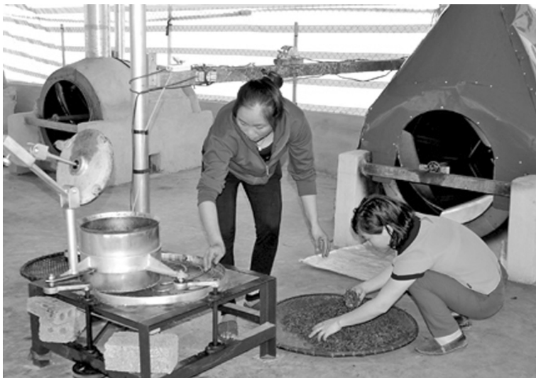
Công đoạn chế biến đã có nhiều cải tiến nhằm sản xuất ra sản phẩm chè xanh đạt chất lượng cao.

Những gì mà người làm chè ở xã Bảo Hưng, xã Hưng Khánh và một số hộ, nhóm hộ ở xã Báo Đáp, Nga Quán mang lại được coi là kết quả bước đầu, là hướng đi để các địa phương trồng và chế biến chè xanh của huyện Trấn Yên thực hiện đến khâu cuối trong chuỗi sản xuất chè an toàn, đáp ứng yêu cầu của thị trường trong thời gian tới.