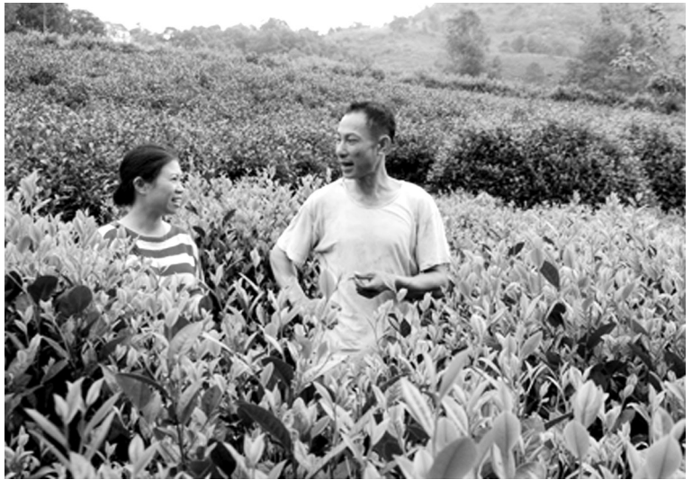
Diện tích chè ở thôn Khe Năm, xã Hưng Khánh được trồng cải tạo bằng giống chè Bát tiên.

Đặc biệt, được sự hỗ trợ của Nhà nước, trong thôn có 5 hộ đứng ra đầu tư xây dựng nhà xưởng chế biến, thành lập nhóm sản xuất chè an toàn, các máy móc thiết bị được đặt