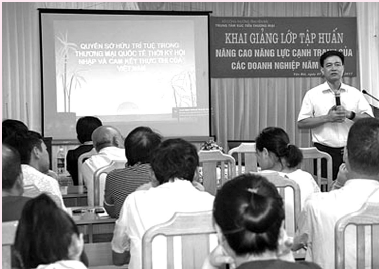
Quang cảnh lớp tập huấn.

Vừa qua, Trung tâm Xúc tiến thương mại (Sở Công thương) phối hợp với Trường Đào tạo, bồi dưỡng cán bộ công thương Trung ương khai giảng lớp tập huấn “Nâng cao năng lực cạnh tranh của các doanh nghiệp năm 2017” cho đội ngũ cán bộ phụ trách công tác xúc tiến thương mại của phòng kinh tế - hạ tầng các huyện, thị xã, thành phố và hơn 60 doanh nghiệp, hợp tác xã đóng trên địa bàn tỉnh.