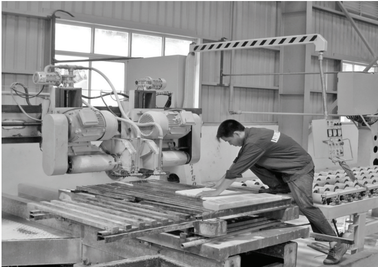
Công ty TNHH RK Việt Nam

T háng 01 trùng với thời gian nghỉ Tết Nguyên đán, thời gian sản xuất tháng 01 của các đơn vị chỉ bằng 2/3 tháng trước nên tình hình sản xuất kinh doanh đầu năm 2017 có những khó khăn nhất định.