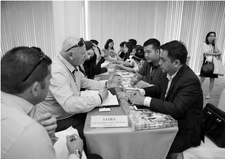
Chương trình XTTM quốc gia 2017 sẽ chú trọng các thị trường đã ký FTA

tham gia đối với hoạt động XTTM tại nước ngoài.