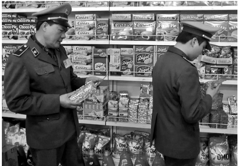
Lực lượng QLTT Yên Bái đang làm nhiệm vụ

Chi cục Quản lý thị trường Yên Bái đã chỉ đạo các Đội Quản lý thị trường: Công văn số 443/QLTT-NVTH ngày 06/12/2016 của Chi cục Quản lý thị trường về mở đợt cao điểm kiểm tra, kiểm soát đấu tranh chống buôn lậu, gian lận thương mại và hàng giả cuối năm 2016 và tết Nguyên đán Đinh Dậu 2017; Công văn số 27/CV-NVTH ngày 19/01/2017 của Chi cục Quản lý thị trường về triển khai công tác đảm