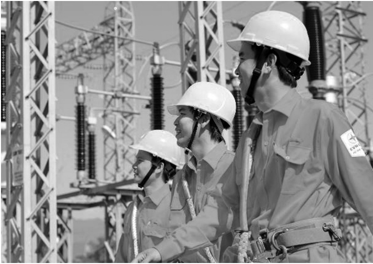
Đẩy mạnh tái cơ cấu ngành điện (Ảnh minh họa)

Các Tổng công ty Phát điện sau khi cổ phần hóa chịu trách nhiệm thực hiện các dự án đầu tư nguồn điện mới được giao theo Quy hoạch phát triển Điện lực Quốc gia giai đoạn 2011 - 2020 có xét đến năm 2030 được Thủ tướng Chính phủ phê duyệt.