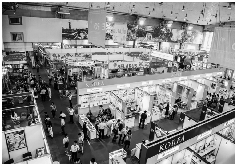
Hội chợ sẽ có gần 600 gian hàng. Ảnh minh họa

Ngoài ra, nhằm hỗ trợ doanh nghiệp trong và ngoài nước tìm hiểu về công cụ kết nối giao thương, tư vấn chính sách đầu tư và nâng cao năng lực thiết kế cho doanh nghiệp và sản phẩm, hội chợ sẽ là điểm đến hữu ích giúp đáp ứng các yêu cầu trên tại các gian hàng: Đầu tư phát triển công nghiệp Việt Nam do Cục Xúc tiến thương mại tổ chức với thiết kế ấn tượng, sẽ trưng bày và giới thiệu các khu công nghiệp tiêu biểu của một số tỉnh/thành phố của Việt Nam cũng như các hoạt động thuyết trình và tư vấn chính sách đầu tư trực tiếp tại gian hàng; Khu gian hàng hỗ trợ thiết kế, phát triển