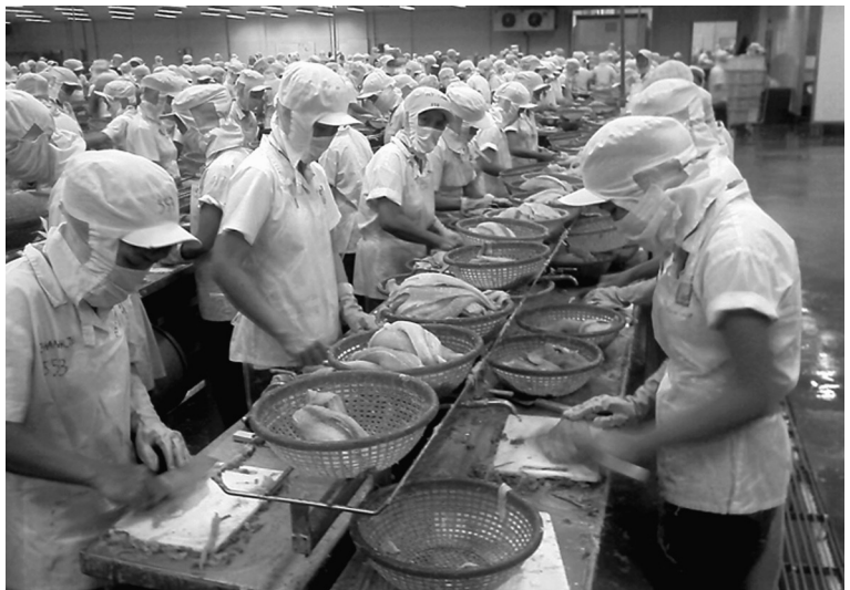
Thủy sản được dự báo tiếp tục là mặt hàng xuất khẩu chủ lực trong năm 2017